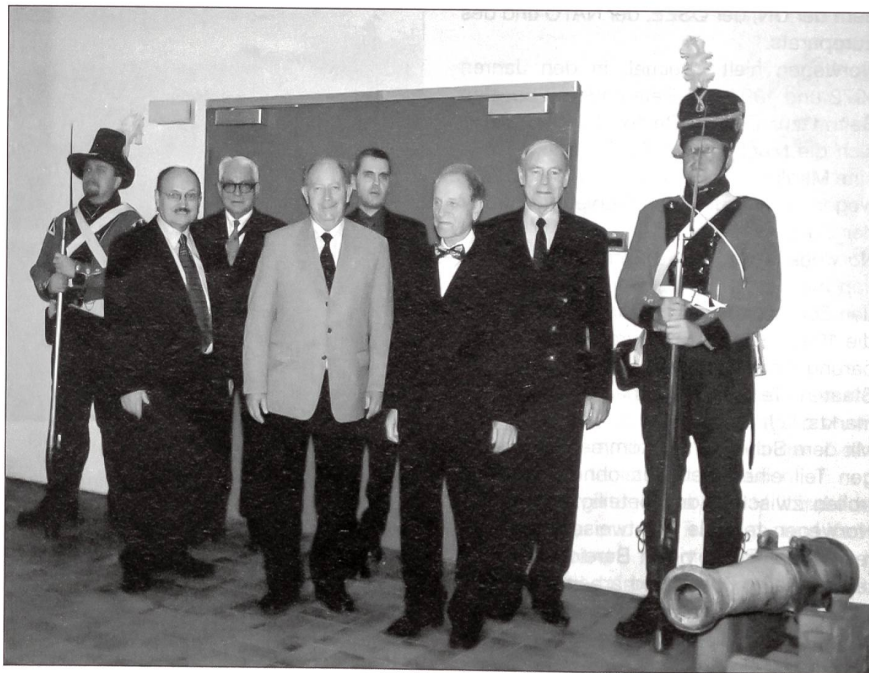
Die Schweizer Delegation, wohl bewacht.

Bereits 1697 wurde die Osloer Domkirche als damals dritte Domkirche der Stadt ein-