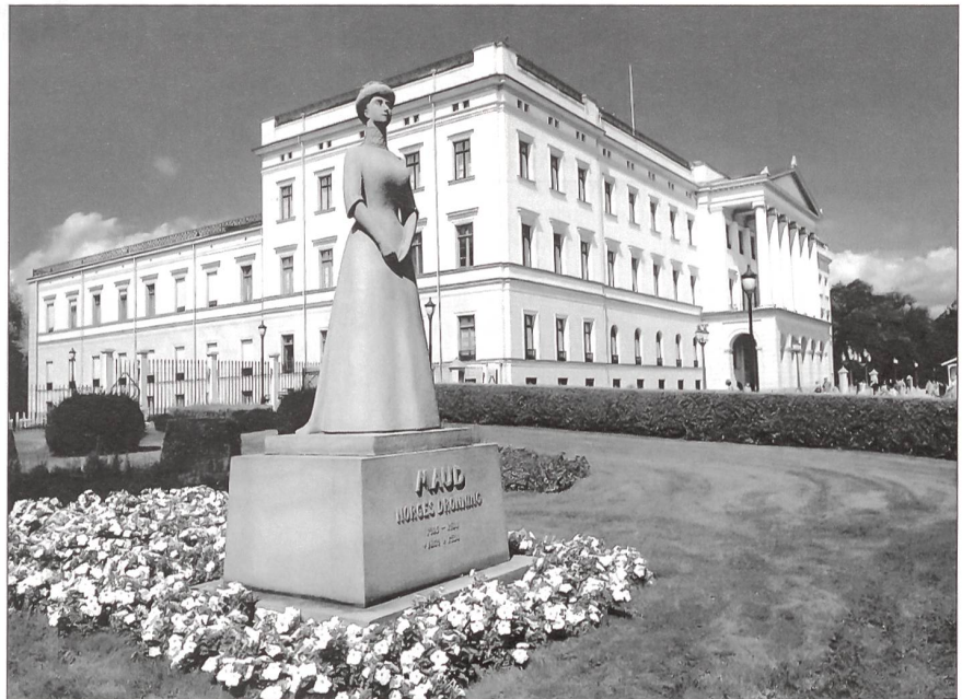
Das Kongelige Slott (Königsschloss).

Oslo ist Skandinaviens älteste Hauptstadt. Der Name geht zurück auf die beiden altnorwegischen Worte as, das Gott bedeutet, und lo mit der Bedeutung Wiese. Die