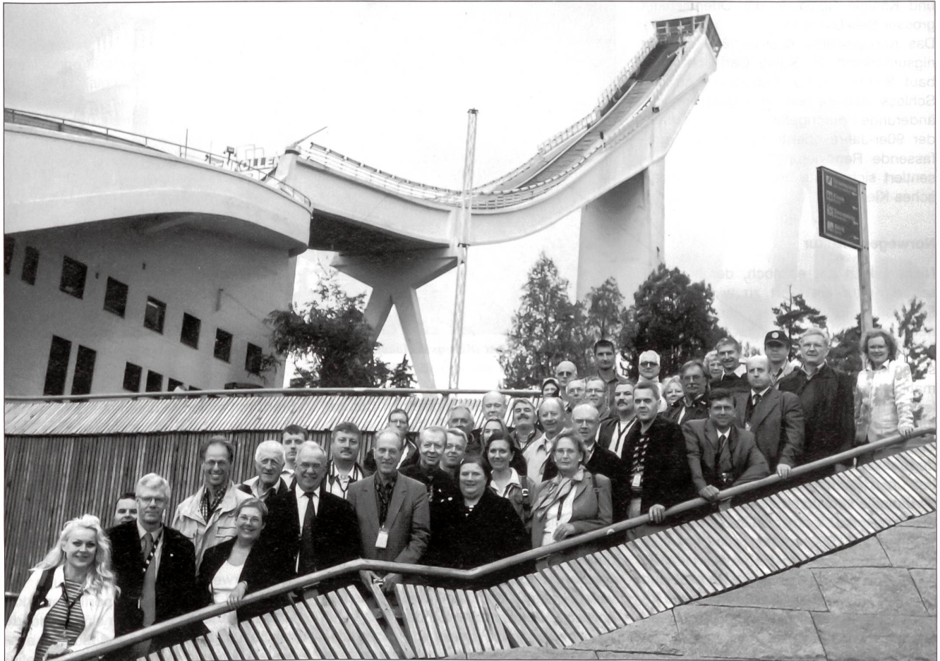
Die Kongressteilnehmer unter der Holmenkollen, einer der meistbesuchten Sehenswürdigkeiten Oslos.

25. Kongress der europäischen Militärredaktoren in Oslo