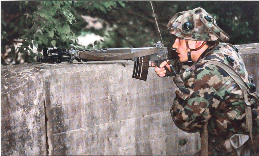
Den Gegner im Visier: Infanterist des Inf Bat 65 mit SIM-Ausrüstung.