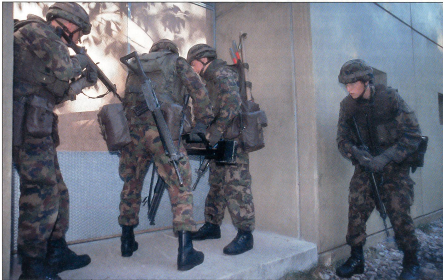
Grenadiertrupp im Ortskampf. Öffnen der Türe mittels eines Rammwerkzeugs.

das Armee-Aufklärungsdetachement 10 liegt direkt beim Bundesrat, im Einsatz ist es dem Chef der Armee unterstellt.