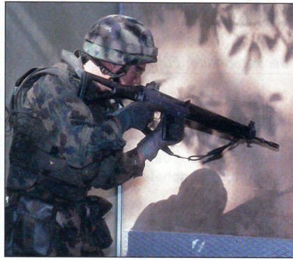
Grenadiere erzwingen den Zugang zu einem Gebäude mittels eines gezielten Schusses.

ohne solche Waffen nicht mehr zu lösen sind, denn Aufgaben im Umfeld von Friedensunterstützung oder eben unterhalb der Kriegsschwelle können mit den heute gebräuchlichen Waffensystemen nicht angegangen werden. Nichtletale Waffensysteme können – je nach Art – gegen Personen wie auch gegen Fahrzeuge, Materialien oder Geräte eingesetzt werden. Für den Einsatz gegen Personenziele sind beispielsweise Antiterrorgeschosse und -granaten gängig, die entweder mittels der bestehenden Infanteriewaffen (mittels Aufsatz) oder spezieller Granatwerfer verschossen werden. Zu nennen sind dabei die allseits bekannten Gummigeschosse, aber auch Stink- und Beruhigungsagenzien, Blitz-, Rauch- und Knallpetarden sowie chemische Substanzen sind in Gebrauch. Bereits in der Praxis sind auch das Verschiessen von Fangnetzen oder -folien zur Isolierung von Personen oder zum Abfangen und Stoppen von Fahrzeugen. Möglich und im Häuserkampf von grossem Nutzen ist zudem der Einsatz von Gleit- und Klebstoffen oder Schaummitteln, welche beispielsweise das Versiegeln von Türen und Fenstern ermöglichen und es den im Innenraum befindlichen Personen verunmöglichen, den Raum zu öffnen und zu verlassen. Bei den Polizeikörpern auch