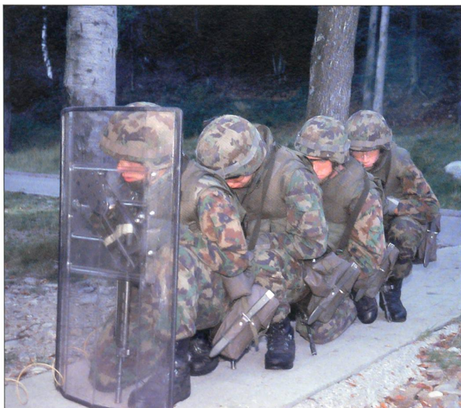
Der Grenadiertrupp schützt sich vor den Folgen der Sprengung einer Tür.

Dem Grenadierkommando 1, welches aus einer Stabskompanie, dem Armee-