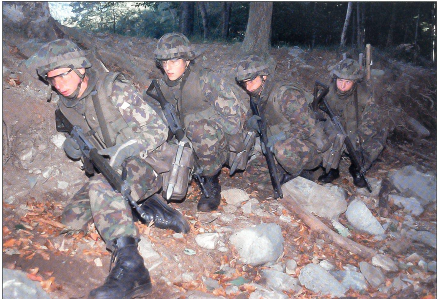
Für die Grenadiere wird der Ortskampf um ein Mehrfaches anspruchsvoller als bisher. Grenadiertrupp in der letzten Stellung vor dem Angriff auf ein Gebäude.

Die Anpassungen bezüglich Bewaffnung und Ausrüstung der Formationen für Sonderaufgaben sind ein lang andauernder Prozess. Bereits mit den bestehenden Ausrüstungs- und Waffensystemen wurde der Kampfwert der Grenadiere erheblich erhöht und wird mit den vorgesehenen