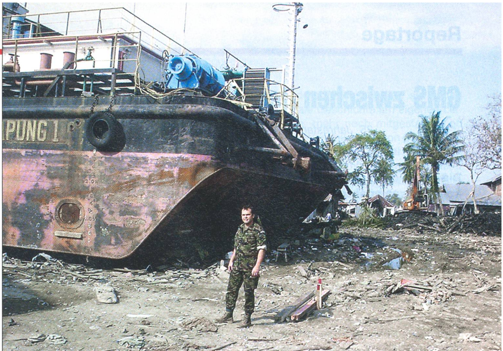
Das Schiff wurde durch die Flutwelle kilometerweit ins Landesinnere geschwemmt.

(ML): Im Arbeitsumfeld der TF SUMA ist eine tiefe Kameradschaft entstanden, welche die grossen Strapazen, wie körperlicher Einsatz, Temperatur, Feuchtigkeit, Heimweh! in den Hintergrund drängten. In sehr kurzer Zeit konnte eine Basis des Vertrauens aufgebaut werden, welche die