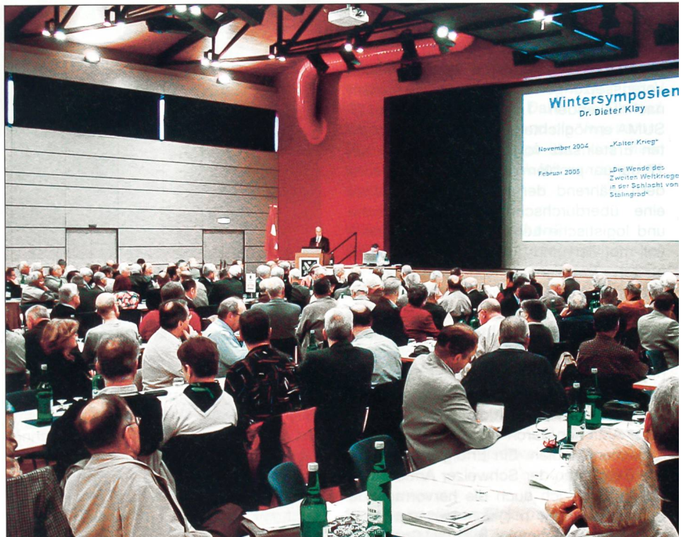
200 GMS-Mitglieder sind in den Bienken-Saal gekommen.

Im Jahre 2004 war die GMS eifrig auf Achse. An insgesamt 161 Tagen fuhren die Teilnehmer nach Griechenland, Gibraltar, Paris, Deutschland und in der ganzen Schweiz an ausgewählte, historisch bedeutende Plätze. 46 Reisen hatte die GMS ausgeschrieben, wegen der grossen Nachfrage konnten sogar 50 durchgeführt werden, an denen insgesamt 1554 Personen teilnahmen. Besonders die 20 Eintagesreisen wiesen hohe Besucherzahlen auf. Alle