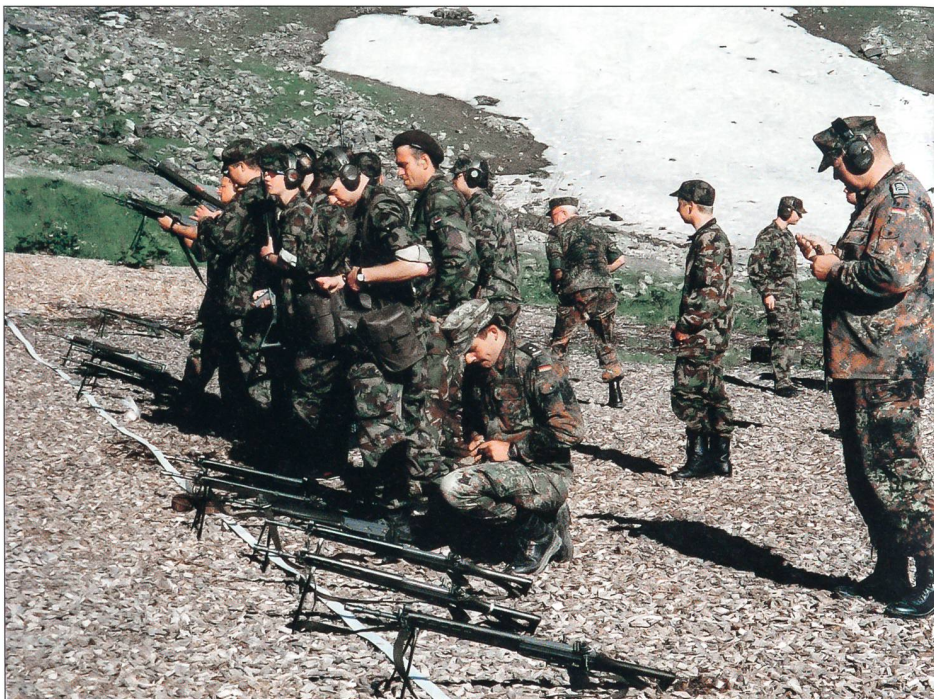
Waffenausbildung am Sturmgewehr 90.

und erlaubt das gleichzeitige Schiessen an mehreren Posten, ohne dass die Sicherheit gefährdet ist. Sehr einfach ist dagegen die Unterkunft im Massenlager über einem