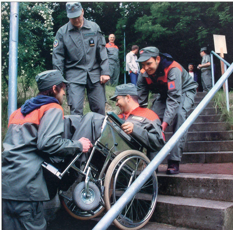
Betreuer lernen den Umgang mit Rollstühlen.

tenten, Betreuer oder Pioniere. Die Ausbildung ist primär auf Katastrophen- und Nothilfe ausgerichtet und dauert 12 Tage. Im Rahmen der gemeinsamen Rekrutierung werden im Zentrum Windisch jährlich rund 450 Schutzdienstpflichtige zu Gunsten des Aargauer Zivilschutzes rekrutiert. Im ersten Teil der Grundausbildung absolvieren die Angehörigen des Zivilschutzes (AdZS) die «Allgemeine Grund-