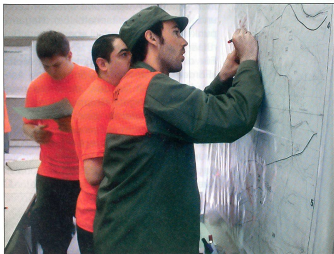
Stabsassistenten im praktischen Einsatz.

Die Ausbildung des Betreuers zielt hauptsächlich darauf, Menschen in schwierigen Situationen zu helfen. Es handelt sich dabei um obdachlose, Schutz suchende, aber auch betagte und behinderte Men-