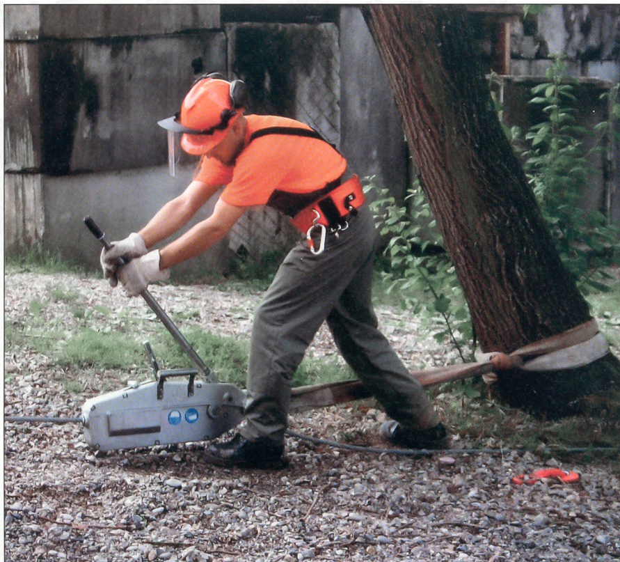
Üben an modernen Geräten.