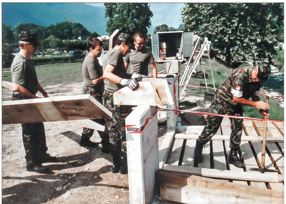
Etwas von der SUT 05 bleibt bestehen: Alle Wettkämpfer beteiligten sich beim Brückenbau.

Als Dank für die gute Aufnahme der SUT in Mendrisio und als Zeichen der Verbundenheit zur Bevölkerung ist durch alle SUT-Teilnehmer eine stabile Fussgängerbrücke erstellt worden. Damit sind beide Seiten der Ebene von San Martino dauerhaft verbunden.