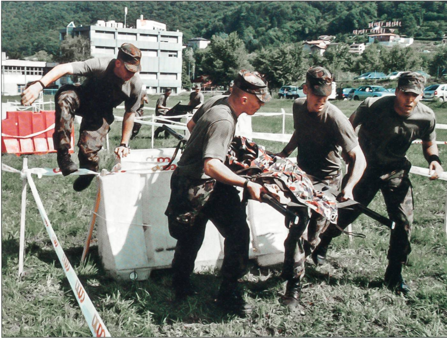
Kräfte raubender Hindernisparcours: Mit einer 40 kg schweren Bahre unterwegs.

schwinden die Kräfte. Die Bahre überschlägt sich, wertvolle Zeit geht verloren. Am Ende der Hindernisbahn gratulieren sich alle zum Erreichten, dies trotz des Missgeschicks. Auch beim ABC- und HG-Posten oder bei den Aufgaben Gruppenführung und Pz/Flz-Erkennung wird mit voller Konzentration gearbeitet.