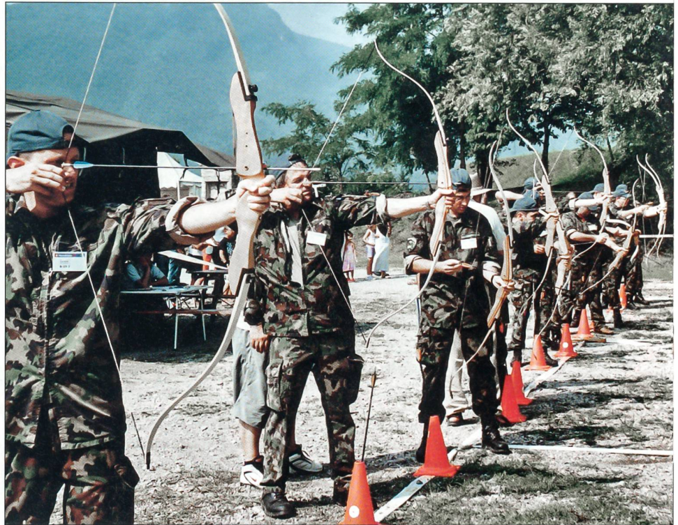
Attraktives und aussergewöhnliches Wettkampfelement: Bogenschiessen.

Das Wetter machte diesem Vorhaben einen Strich durch die Rechnung. Vor allem die Wettkämpfer und Zuschauer sind während der rund eineinhalb Stunden dauernden Eröffnungsfeier zum Teil heftigen Regenfällen ausgesetzt gewesen, was bei einigen Wettkämpfern Unmutsbekundungen aus-