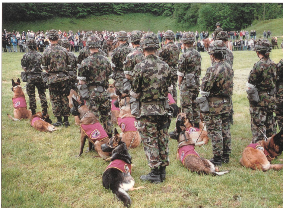
Der Hundeführerzug der RS 57-1/05 mit ihren Diensthunden.

In fast historisch anmutenden Gebäuden untergebracht sind sowohl Ställe, Büros und etwas moderner die Truppenunterkunft. Am 10. Juni 2004 nahm das neue Zentrum als Teil des Lehrverbandes Logistik 2 im Sand seinen Betrieb auf. Seither