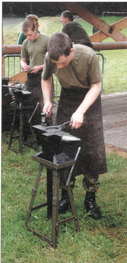
Starke Männer an einer Feld-Hufschmiedsstelle.

Die Trainsoldaten: Trainpferde werden üblicherweise dort eingesetzt, wo Fahrzeuge oder Helikopter nicht mehr verwendet werden können. So müssen Mannschaft und Pferde in schwierigem Gelände Transportleistungen zugunsten der Truppe oder zivilen Behörden erbringen. Die Ausbildung sieht in erster Linie die Pferdepflege sowie die korrekten Transportarten vor. Da das richtige Beladen der Tiere, das Basten, und die Transporte in unwegsamem Gelände im Sand nicht realitätsgetreu geübt werden können, werden diese praktischen Einsätze entweder oberhalb Boltigen im Simmental oder rund um Andermatt geübt. Die Trainsoldaten müssen stets in der Lage sein, die ihnen anvertrauten Tiere sicher zu führen und sich situationsgerecht zu verhalten.