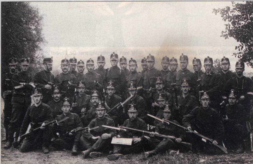
Für ungepflegte Waffen gabs für unsere Vorväter schon Bussen: Altes Kompaniebild des Zürcher Füs Bat 70 mit aufgesetztem Bajonett!

Die einsetzende Herrschaft des Liberalismus bringt dem Kanton Zürich neben der Kantonsverfassung auch ein Militärorganisationsgesetz für den Kanton Zürich vom 8.8.1832 hervor. In dieser Zeit werden auch die «Sectionschefs» zum ersten Mal erwähnt. Im «Reglement betr. Anstellung und Verrichtungen der Sectionschefs in den Quartieren» vom 22. 7. 1833 wird festgehalten, dass die Quartierkommandanten für jede Gemeinde einen Sektionschef anzustellen haben. Dieser soll zuvor Exerzier- oder Schützenmeister gewesen sein. Offiziere und Unteroffiziere der Landwehriinfanterie werden für diese Aufgabe bevorzugt. Die Sektionschefs führten Namensverzeichnisse der dienstpflichtigen Mannschaft, hatten Militärflichtersatz und Bussen einzuziehen und alle Aufträge vorgesetzter militärischer Stellen auszuführen. Die Entschädigung für die Sektionschefs bestand aus einem Anteil am Militärflichtersatz und an den Bussen. Schon von Anfang an gabs für die Sek-