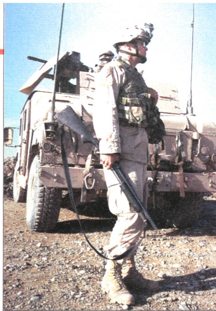
Soldat der Task Force DANGER während einer Sicherheitsoperation nördlich von Bagdad kurz vor den Wahlen Januar 2005. Er ist mit einer Mossberg-500-Schrotflinte im Kaliber 12 für den Häuserkampf bewaffnet. Der HMMWV (High Mobility Multipurpose Wheeled Vehicle) im Hintergrund ist mit einem 40-mm-Granatwerfer ausgestattet und sichert die Aktion ab.

Nach einer Sicherheitsoperation nördlich von Bagdad sammelt sich die Infanteriegruppe der Task Force 2-2 an ihrem BRADLEY-M2-Schützenpanzer. Dieser ist mit einer 25-mm-BUSHMASTER-Kanone und gegen Panzerabwehrgechosse RPG-7 mit zusätzlicher reaktiver Panzerung ausgestattet.