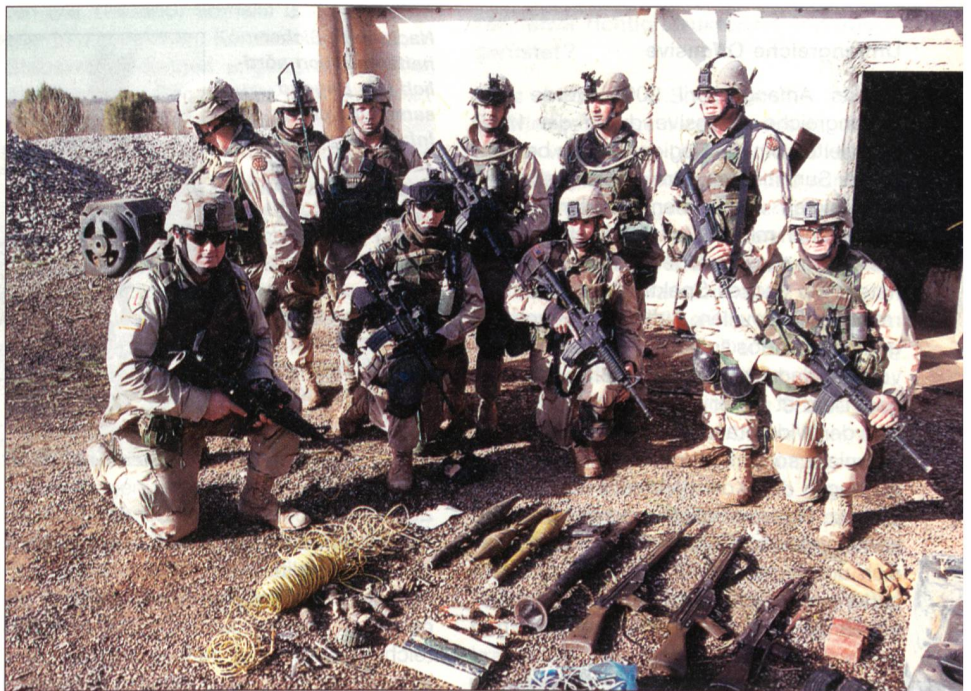
Soldaten der Task Force DANGER präsentieren erbeutete Waffen nach einer Sicherheitsoperation gegen Aufständische nördlich von Bagdad kurz vor den Wahlen im Irak. Es handelt sich dabei um diverse AK-74, RPG-7, Sprengstoff, Handgranaten und deutsche G3 von HK aus arabischer Lizenzproduktion.

Militärisch gesehen, war der Krieg kurz und relativ gut geplant. Die Kombination zwischen gewaltigen Luftschlägen, gut koordinierten Einsätzen von Special Forces und leichten motorisierten und mechanisierten Infanteriebrigaden zahlte sich schon in den ersten Kriegstagen aus.