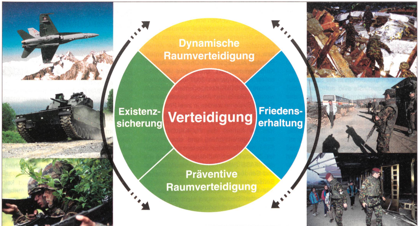
Mehrwert und Informationsüberlegenheit im Battle Space durch den Verbund von Sensoren, Effektoren, Entscheidungsträgern und Leistungserbringern – Konzept der networked centric Operationsführung. Zentrum für Elektronische Medien VBS

vernetzt, dadurch wird die Befehlsausgabe beschleunigt, das Operationstempo erhöht und die Wirkung im Ziel gesteigert. Gleichzeitig wird die Überlebensfähigkeit der eigenen Verbände erhöht. Insgesamt wird der Kampfwert der Streitkräfte massiv erhöht.