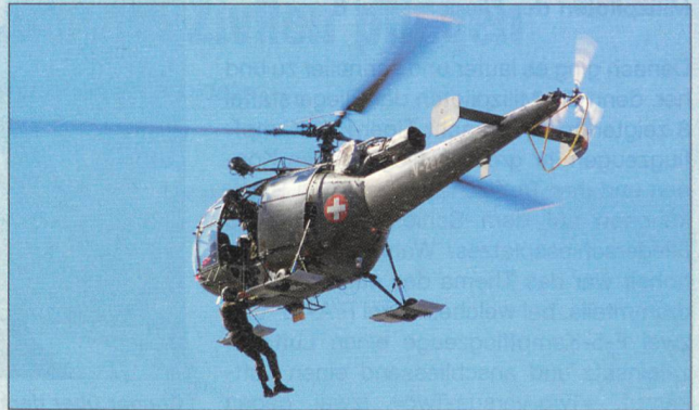
Rettungseinsatz mit einer Alouette III.