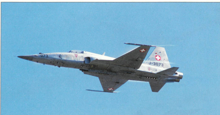
Tiger F-5 beim Kanonenschieszen.