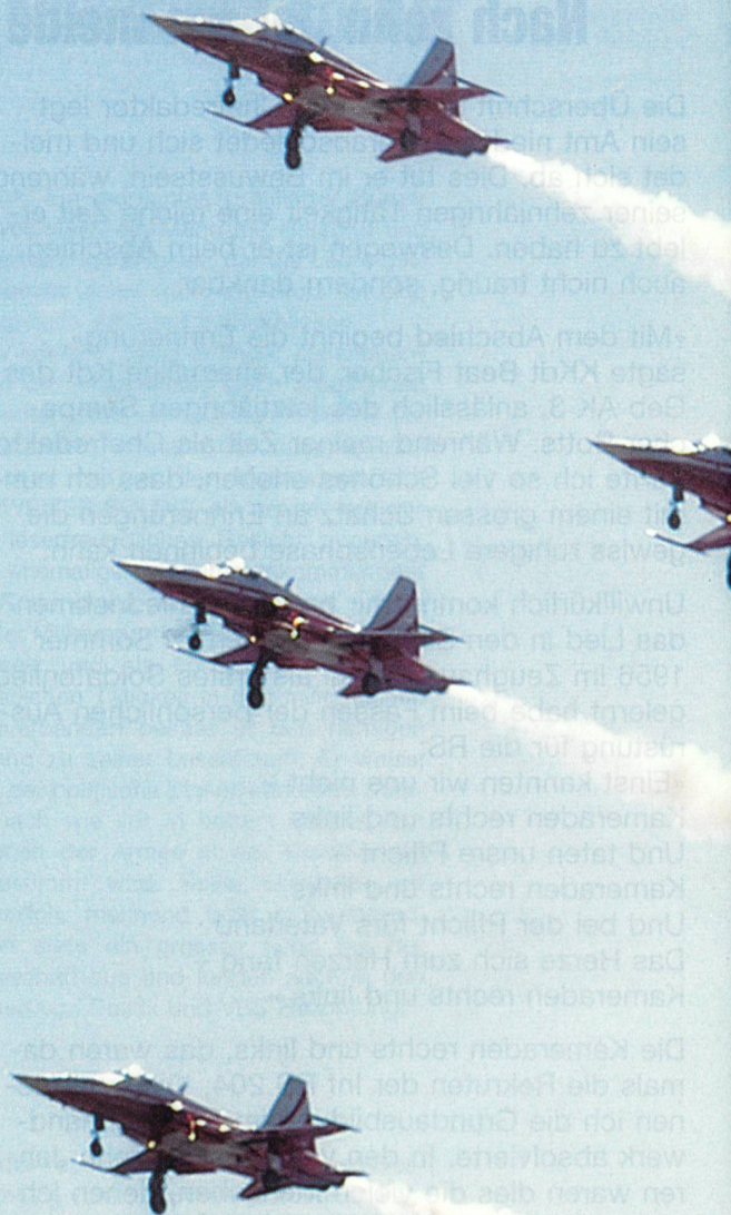
Die Vorführung der Patrouille Suisse konnten die Zuschauer hautnah und auf Augenhöhe erleben.

Punkt 14.00 Uhr wurde das Programm mit einem überraschenden und spektakulären Cougar-Auftritt eröffnet. Beim ersten Vorbeiflug des modernen Transporthelikopters liessen die Piloten 128 Flares aus dem Selbstschutzsystem Issys ausstossen und begeisterten mit dem schönen Lichtzauber das Publikum. Anschliessend wurde die Flugleistung und die Wendigkeit des Cougar-Helikopters eindrücklich demonstriert. Eine supponierte Rettungsaktion im Gebirge mit einer Alouette III, der Absprung von Fallschirmaufklärern aus einem Pilatus-Porter sowie die Feuerlöschdemonstration zweier Super-Puma-Helikopter waren die nächsten Programmpunkte.