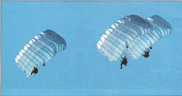
Fallschirmaufklärer nach Absprung aus einem Pilatus-Porter.