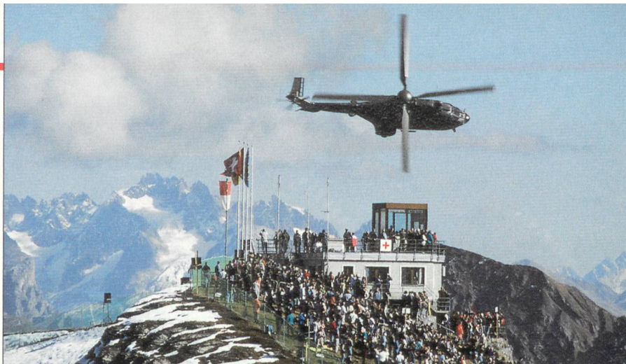
Cougar über dem KP des Fliegerschiessplatzes Ebenfluh.

Die eindrückliche Demonstration der Luftwaffe gab einen sehr guten Einblick in den hohen Ausbildungsstand der Fliegertruppe, zeigte aber auch auf, wie wichtig gutes und modernes Material sowie geeigneter Trainingsraum ist, um die Einsatzbereitschaft auf hohem Niveau zu halten. ☒