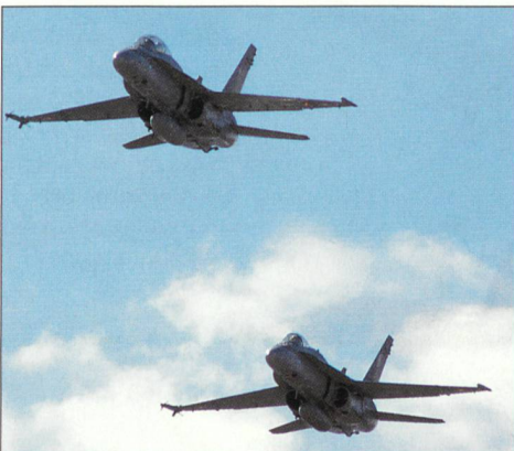
Überflug der Hornets.