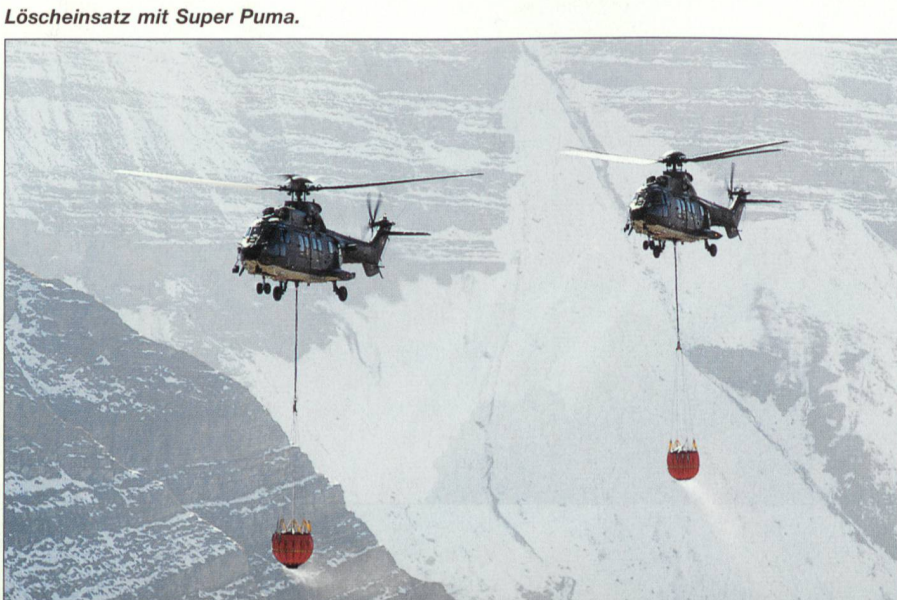
Löscheinsatz mit Super Puma.