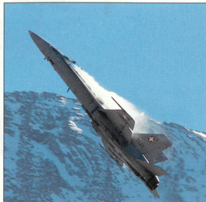
Display-Pilot mit atemberaubender Vorführung mit dem F/A-18.