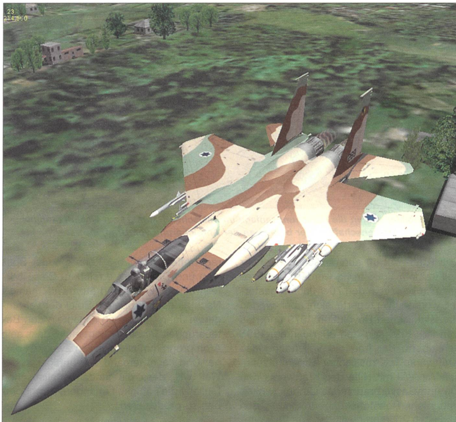
Israelische Kampfmaschine IS F-15I (Computersimulation).

Die iranische Ölindustrie allerdings würde z. B. den Export nicht nur wegen des Geldes benötigen, sondern auch wegen des Rückflusses der raffinierten Ölprodukte, wie Gas und anderes, weil sie nicht genug Kapazitäten bei Raffinerien hätten. Auch hänge die iranische Wirtschaft völlig von den Ölexporten ab. Wenn tatsächlich ein Ölembargo ausgesprochen würde, wäre Iran weit mehr davon betroffen als der Rest der Welt.