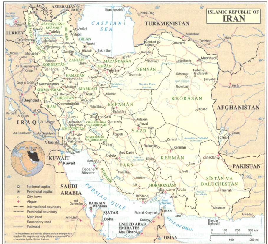
Im Mittelpunkt des Interesses: Iran.

Als atomare Hauptanlagen Irans werden genannt: Vor allem das gemeinsam von Iran und Russland errichtete Atomkraftwerk