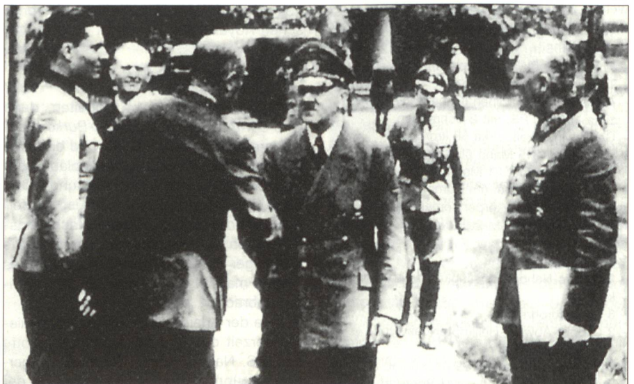
Am 15. Juli 1944 in der «Wolfsschanze»: ganz links Claus von Stauffenberg, in der Mitte Hitler, rechts Wilhelm Keitel.