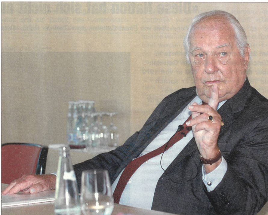
Ewald Heinrich von Kleist: Im Sinne der preussischen Bescheidenheit will er kein Held sein.

Von Kleist vertraute sich seinem Vater an. Dieser riet ihm, an der Verschwörung teilzunehmen und sich selbst zu opfern: «Ja, du musst es tun. Jeder, der eine Gelegenheit wie diese vorübergehen lässt, wird in seinem Leben nie mehr glücklich sein.» Die neue Vorführung wurde auf den 11. Februar 1944 angesagt, aber diesmal sagte Hitler den Termin kurz davor ab. Von Kleist wäre bereit gewesen, sein Leben einzusetzen; aber er kam nicht dazu. Nun entwickelten die Verschwörer den Plan «Walküre». Dieser beruhte auf drei Säulen: – Erstens wollte nun Stauffenberg selbst Hitler im Hauptquartier «Wolfsschanze» umbringen. Von Kleist erinnert sich: «Hitler umgab sich mit strengsten Schutzmassnahmen. Es gab kaum Leute, die an ihn herankamen. Aber wir mussten Hitler töten; denn für viele in der Wehrmacht war ihre Eidesverpflichtung auf Hitler von gros-