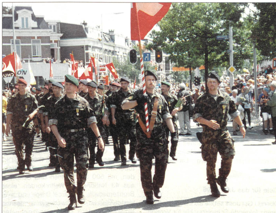
Militärgruppe in Nijmegen.

Wie immer kann man sich online anmelden, dies auf der Internetseite www.2tagemarsch.ch , wo weitere interessante Informationen abgerufen werden können. Weitere Auskünfte sind auch über die E-Mail-