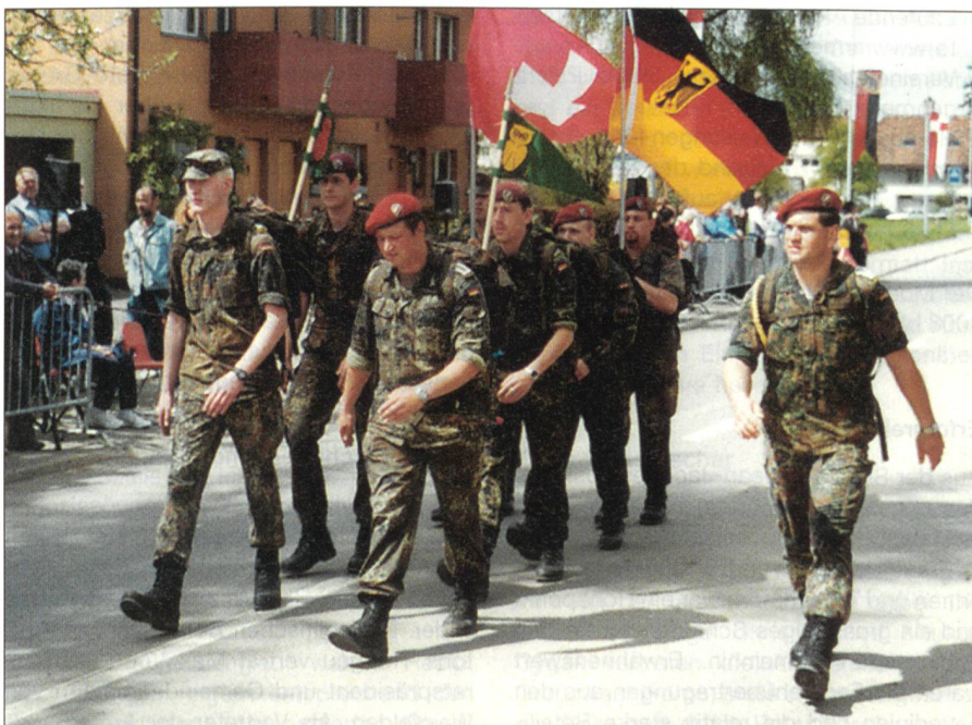
Eine multinationale Marschgruppe, zusammen geht es leichter.