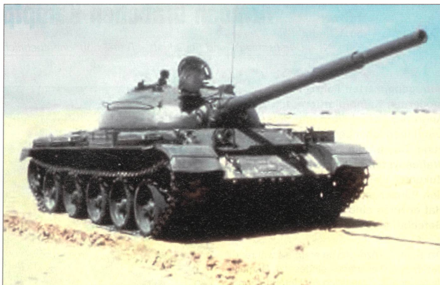
Der T-55 mit seiner 100-mm-Kanone.

Da in diesem Zeitpunkt die Bewegung einen Schutz darstellte, wurden ebenfalls Rohrstabilisatoren entwickelt, welche es der Panzerbesatzung erlaubten, aus dem