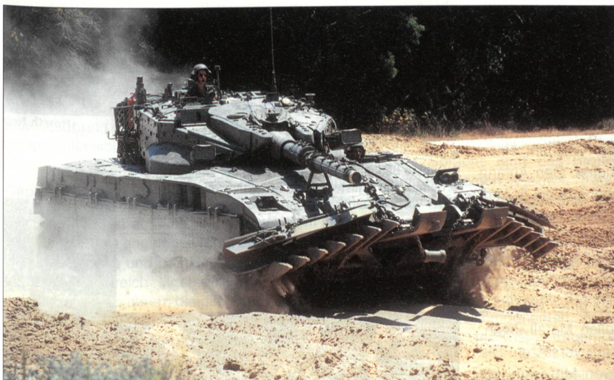
Der Merkava ist Israels modernster Panzer und bildet heute das Rückgrat seiner Bodentruppen. Auf dem Bild die Minenräum-Version.