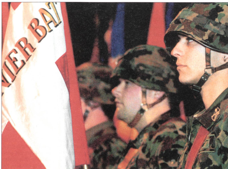
Verabschiedung der Felddivision 5 im Dezember 2003 in Aarau (Titelblatt der neuen Schrift).