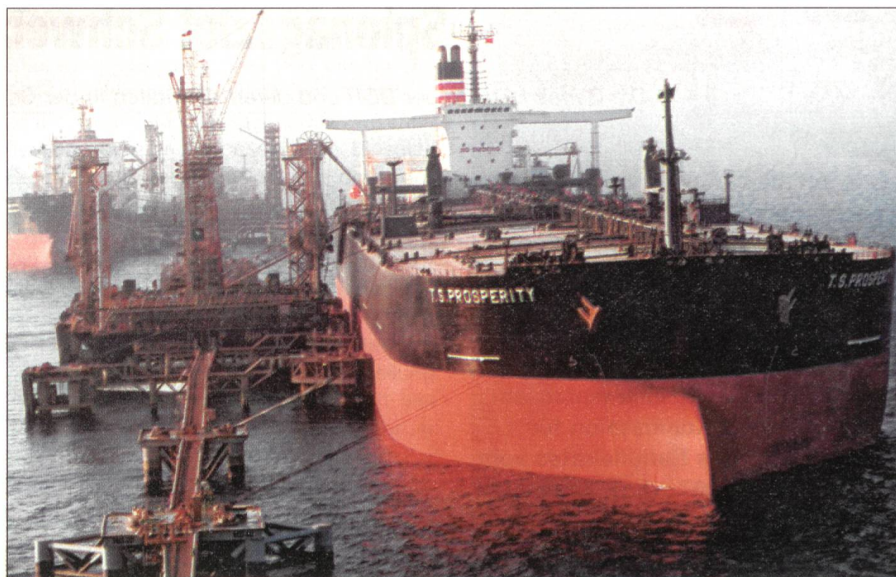
Erdöltanker in Saudi-Arabien: Gefahr für die «Tankstelle der Welt».

sinkt dann wieder auf null ab. Dann ist das Feld leer oder zumindest in einem Zustand, dass man nicht mehr rentabel fördern kann. Der Peak Oil ist also nicht das Ende des Erdölzeitalters. Sondern die Halbzeit. Der Moment, in dem das absolute Maximum an Erdöl gefördert wird. Danach gehts runter, für immer, und das Angebot kann die Nachfrage nicht mehr befriedigen. Und daher wird um den Rest immer heftiger gestritten.