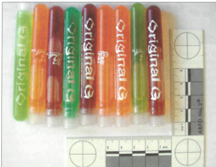
Drogenhandel: Gammahydroxybutyrat (GBH) wird in der Szene auch «Liquid Ecstasy» genannt, ist aber mit diesem chemisch nicht verwandt.

Unsere nationale Sicherheit ist geprägt durch die oben erwähnten Herausforde-