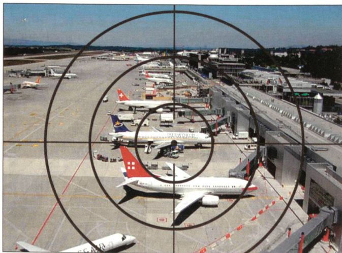
Der Luftverkehr im Visier des Terrors.

Was tut unsere Armee in dieser Lage? Sie bemüht sich um die zum Teil noch gravierenden Mängel der letzten Reorganisation («Armee XXI»), insbesondere auf dem Gebiet der Ausbildung und des Personellen. Umfangreiche und dringende Garantearbeiten müssen noch vollendet werden. Das