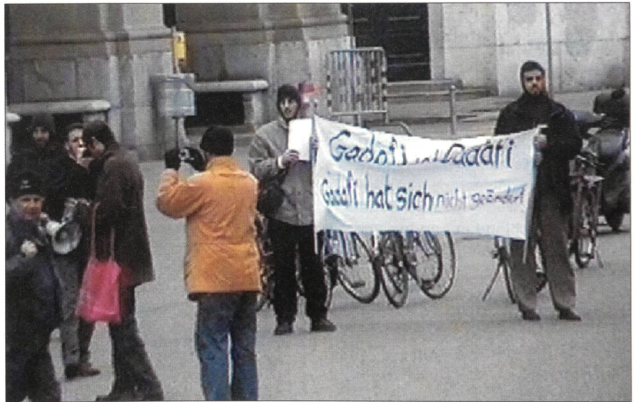
Aufforschung oppositioneller Emigranten. Das Bild stammt aus einem von der Polizei beschlagnahmten Video.

Der überholte Föderalismus in Sachen innere Sicherheit muss ein für alle Male verabschiedet werden. Auch gewisse Polizeikommandanten müssen in diesem Prozess über ihren Schatten springen. Der anerkannt sehr gut ausgebildeten und einsatzbereiten Militärischen Sicherheit muss ihr