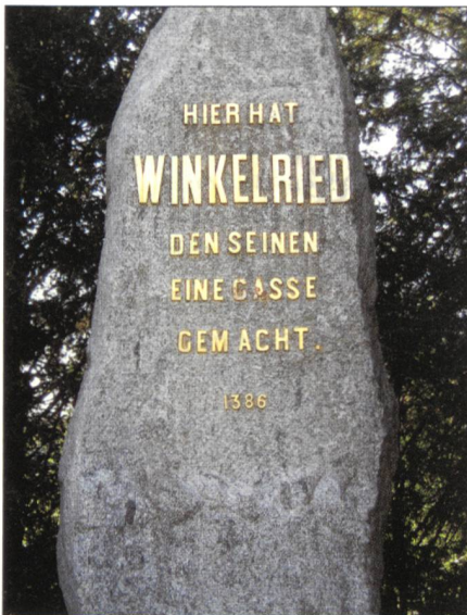
Der Gedenkstein für Arnold von Winkelried.