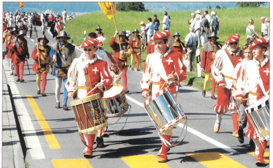
Der Einzug der Abordnungen nach dem Festzug von Sempach auf das Schlachtfeld.