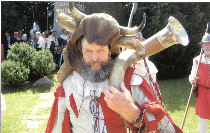
Zur Erinnerung an die Schlacht von 1386.