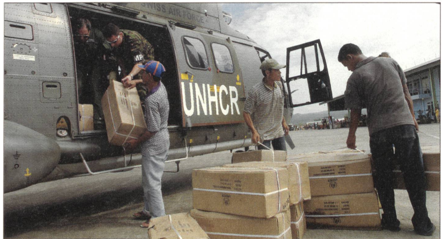
2005: Hilfseinsatz in Sumatra.

Die Teilnahme an der PfP, welche die Schweiz 1996 vollzog, war aus heutiger Sicht die richtige Entscheidung. Ein Fernbleiben wäre eine verpasste sicherheitspolitische Chance gewesen, zumal es in den 1990er-Jahren auch darum ging, die Schweiz bei veränderten sicherheitspolitischen Rahmenbedingungen neu zu positionieren: Die Neutralität soll unangetastet bleiben, aber ein völliges Abseitsstehen läge nicht in unserem Interesse und wäre von unseren Nachbarstaaten nicht verstanden worden. Ein «offshore-Verhalten» geht vielleicht bei privaten Unternehmen, sicherheitspolitisch führt es jedoch in die Sackgasse: Die Schweiz gehört zu Europa und wir können