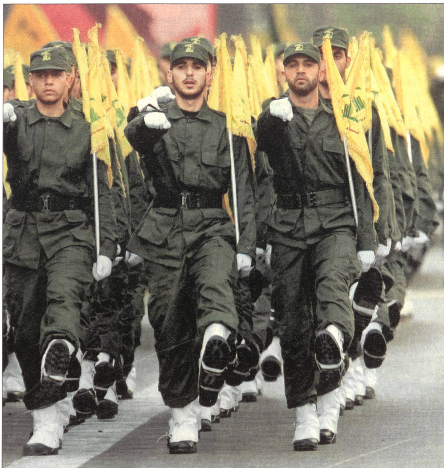
In Paradeuniformen marschieren Milizionäre durch das Schiitenviertel Haert Hreik in Beirut. Ende Oktober 2005, am Jerusalem-Tag bekräftigten sie ihren Anspruch auf die heilige Stadt.

Israel blockiert den Libanon zu Wasser und in der Luft. Der Flughafen, der Hafen und Teile von Beirut sowie andere Hisbollah-Gebiete wurden zerbombt, und entlang der libanesischen Küste verhindern israelische Kriegsschiffe den «Transfer von Terroristen und Waffen». Israel versucht, die Miliz und deren Infrastruktur (Kämpfer, Waffen, Führungszentren, Nachschubwege usw.) zu zerstören.