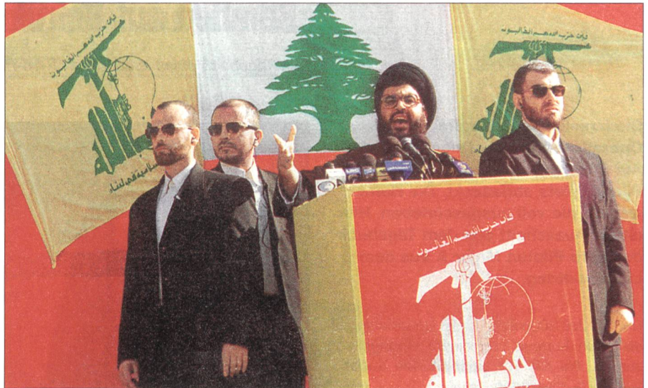
Geschützt von Leibwächtern, ruft Scheich Hassan Nasrallah zum Kampf gegen Israel auf. Er ist der Anführer der Hisbollah. Seine religiöse Ausbildung erhielt der Schiit in der Ghom, der heiligen Stadt.

Hightech-Waffen («Drohnen», Seezielenk-Waffen C-802), die Fähigkeit, auf unkonventionelle Machtquellen zurückzugreifen und ein hoher technischer Entwicklungsstand gehen weit über die bisher in der Welt bekannten Standards terroristischer