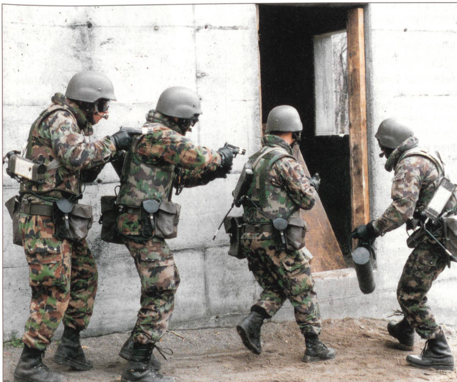
Bundesrat Schmid: «Die Ausbildung ist gründlicher geworden in der Armee 95.»

Samuel Schmid: In der Gesamtbilanz kommt die neue Ausbildung gut an. Die Grundausbildung von Rekruten und Kader