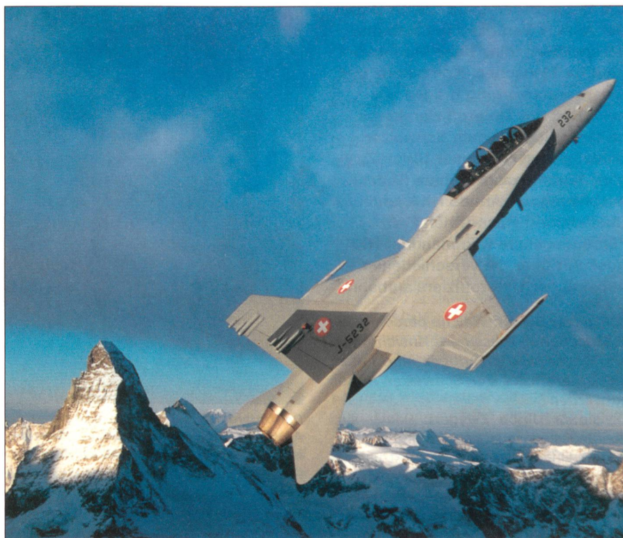
Die Luftwaffe soll weiterhin auch in den Alpen üben können.

Das Training im Ausland hängt von der Bereitschaft der Partnerstaaten ab, die Übun-