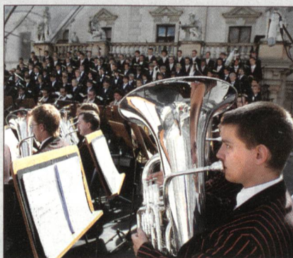
Militärmusik auf hohem Niveau.