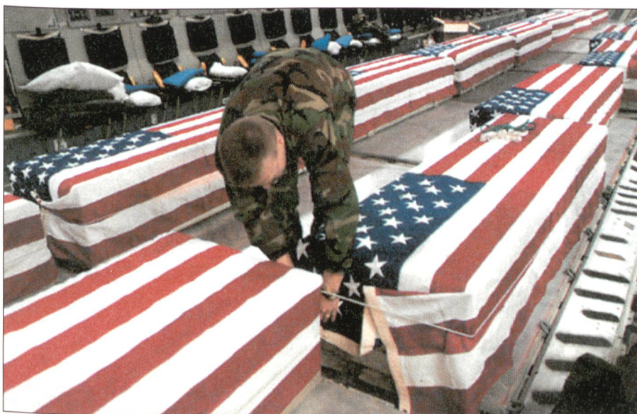
Durch den Söldnereinsatz soll die Zahl der Gefallenen tief gehalten werden.