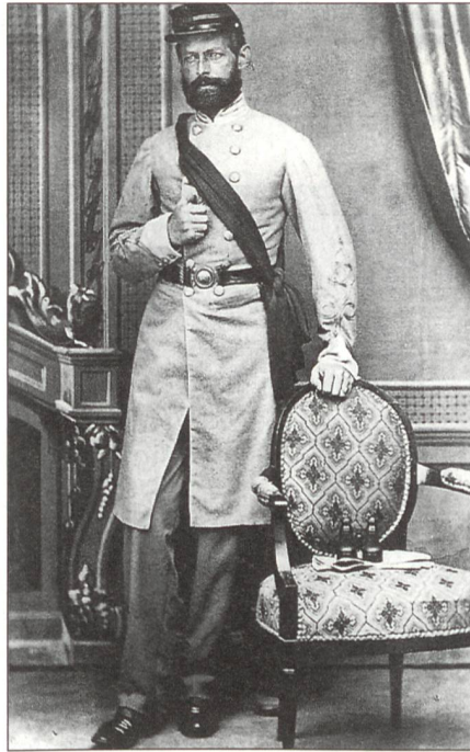
1863/64 reiste Henry Wirz für vier Monate nach Europa. Dabei besuchte er auch die Schweiz. Das 1863 von einem Fotografen in Baden aufgenommene Bild zeigt Wirz in der Uniform der Südstaaten.

Dass Henry Wirz nach dem Bürgerkrieg als einziger «Kriegsverbrecher» am Galgen endete, dafür gibt es verschiedene Gründe. Wirz diente der Justiz in erster Linie als Mittel zum Zweck: Im Fadenkreuz der Jus-