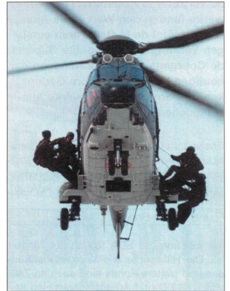
Kühner Einsatz des AAD 10 aus der Luft.

Die anspruchsvollen Grundanforderungen werden wie folgt geschrieben: abgeschlossene dreijährige Berufslehre, Matura oder gleichwertige Ausbildung; Angehöriger der Schweizer Armee; Führerausweis Kategorie B, Sehstärke Minimalvisus 0.8; reife Persönlichkeit; einwandfreier Leumund; sehr gute körperliche Verfassung;