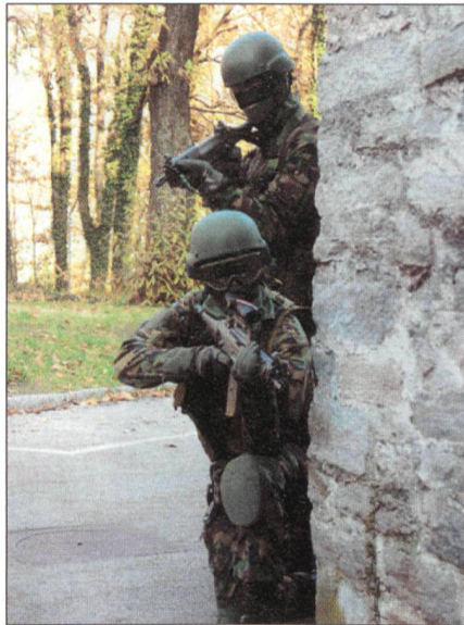
Kämpfer des AAD 10 im Training.

Wie auf dem Internet öffentlich nachzulesen ist, bildet das AAD 10 eine Berufsinformation der Schweizer Armee, die