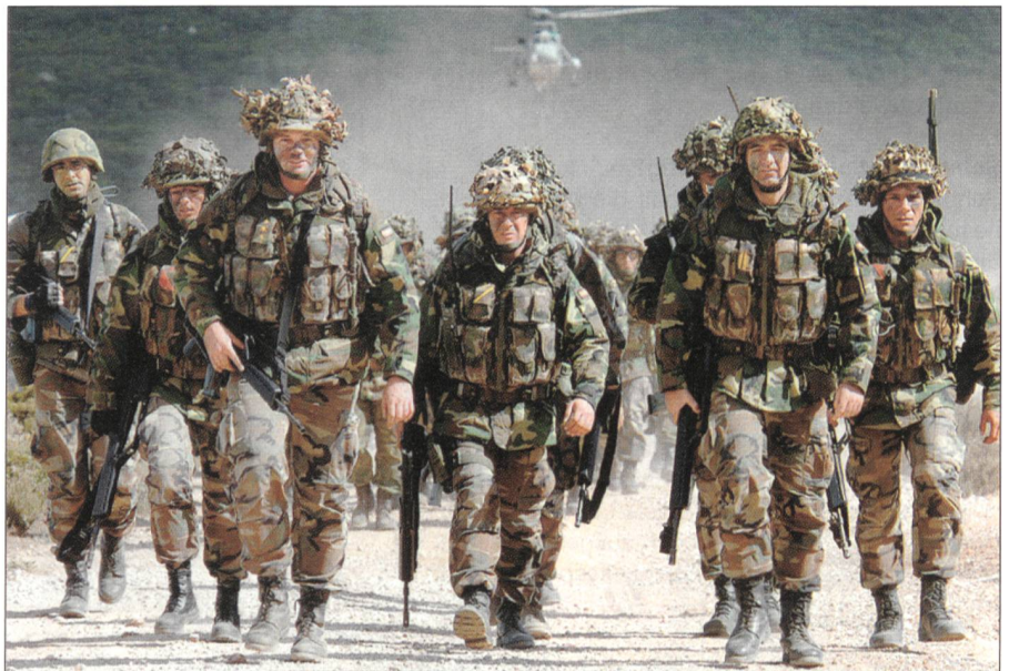
Auch in EU-Operationen spielt die Infanterie eine zentrale Rolle.

2. Paradoxerweise kann der EU-Militärstab auch auf die eingespielten Strukturen des Nordatlantikkpakt zurückgreifen – also auf das Bündnis, gegen das eine eigene Position aufgebaut werden soll. Der NATO-Oberbefehlshaber ist stets ein Amerikaner, sein Stellvertreter immer ein Europäer. Wenn jetzt die EU die Führung einer ihrer Militäroperationen der NATO übergibt, dann kommandiert der britische General