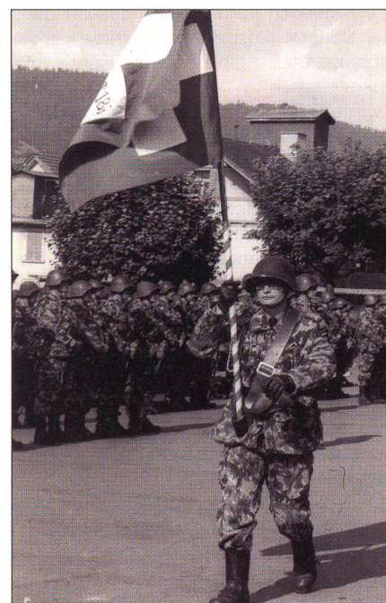
Als Adjutantunteroffizier und Bataillonsführer.