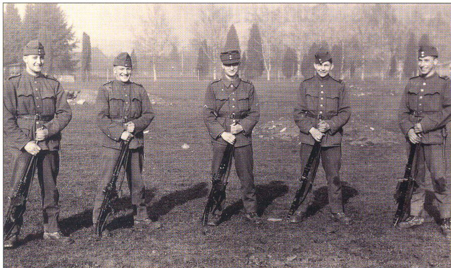
Beim Abverdienen des Korporalgrades (Mitte).

Unsere herzliche Gratulation, unser Dank und unsere Wünsche richten sich deshalb an Euch beide.