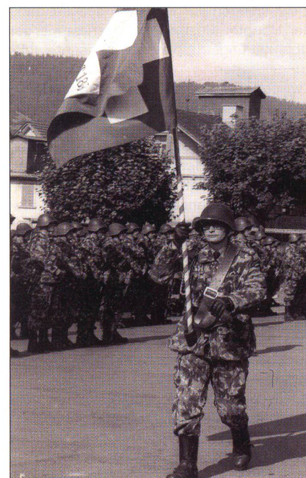
Als Adjutantunteroffizier und Bataillionsführer.