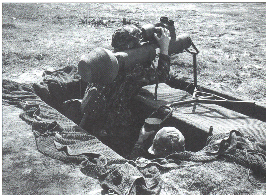
Im Verlaufe der Weiterentwicklung der TO 61 wurden namhafte Mengen an modernen Panzerabwehrlenk Waffen beschafft, darunter amerikanische Lenk Waffen der Typen TOW und – hier gezeigt – Dragon.

Dazu zählen etwa folgende Beispiele: 1972 beschlossen und 1974 erfolgte Abschaffung der Kavallerie – Umschulung zu Panzergrenadiern, ab 1971 Einführung der Mech Artillerie bis zu einem Bestand von insgesamt 31 Abteilungen mit gegen 560 Pz Hb M-109, 1977 erste Tranche von insgesamt 120 Tiger-F-5E -Kampfflugzeugen, 220 Kampfpanzer des Typs Pz 68, Panzer-