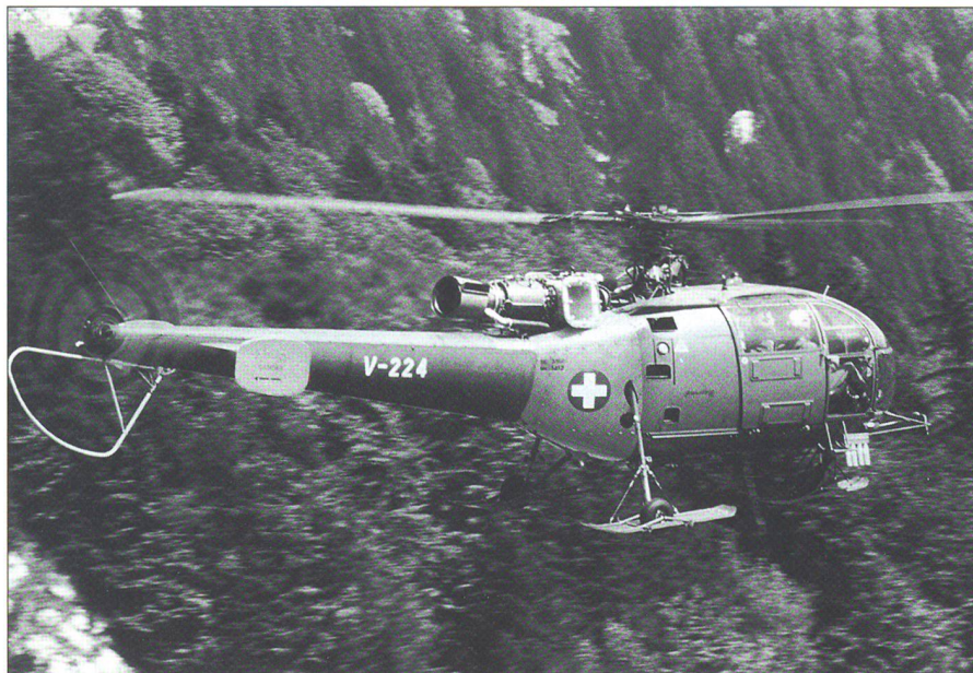
Erstmals wurden im Rahmen der TO 61 auch grössere Mengen an Helikoptern beschafft, sodass die Armee schliesslich über 100 Alouette II und Alouette III verfügte. Die Aufnahme zeigt eine französische Alouette III.

der Baubeginn der AMPs und Geländeverstärkungen im Grenzraum finanziert werden.