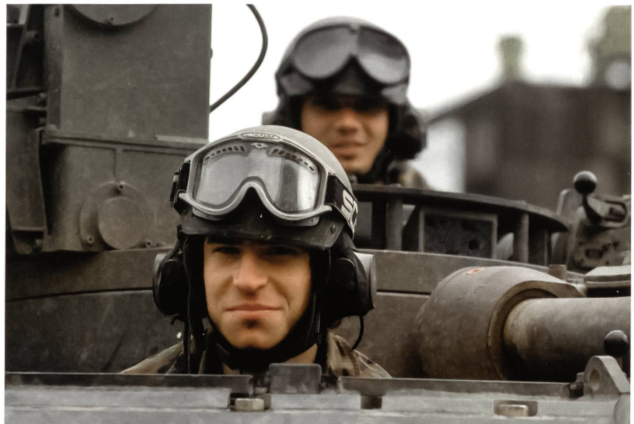
Auf der Schwimmbrücke über die Aare.

In gut einer Stunde gelingt der Brückenschlag trotz der starken Strömung. Kompanie nach Kompanie überquert das Panzersappeurbataillon unter dem Kom-