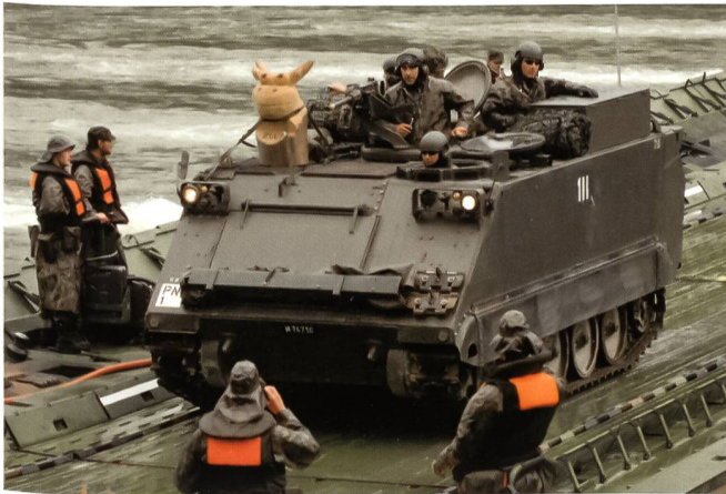
Spitzenfahrzeug 1. Zug Panzersappeurkompanie 11/1.