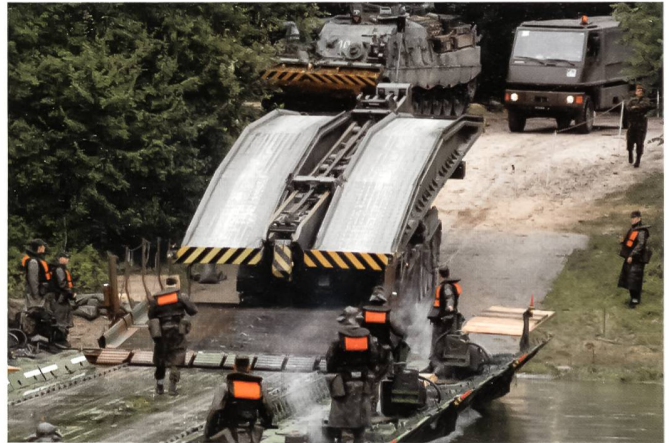
Brückenpanzer am Südufer.