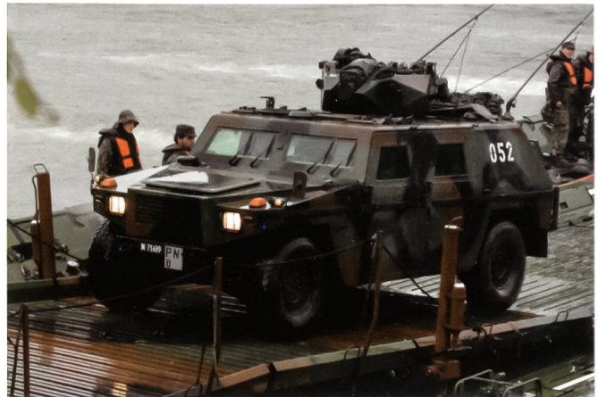
Aufklärer am Brückenkopf Nord.