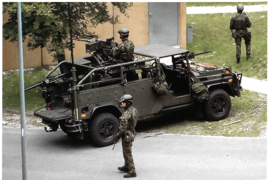
AUF 06: Elitetruppe für Sonderoperationen.

Als Transportmittel steht eine angepasste Version des Superpuma zur Verfügung, welcher über eine Vorrichtung zum Abseilen von vollausgerüsteten Soldaten bei vorbereitenden Aktionen sowie eine Vorrichtung zum «fast roping», dem schnel-