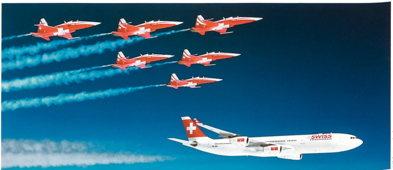
Patrouille Suisse in Formation mit einem Airbus A-340 300 der Swiss.

Leadership in der Patrouille Suisse bedeutet: «Be in a top team, not on top of the team!» Der Leader muss nicht die Lösung bringen, sondern den Prozess zur Lösungsfindung führen. Er schafft günstige Voraussetzungen für eine offene, kommunikative