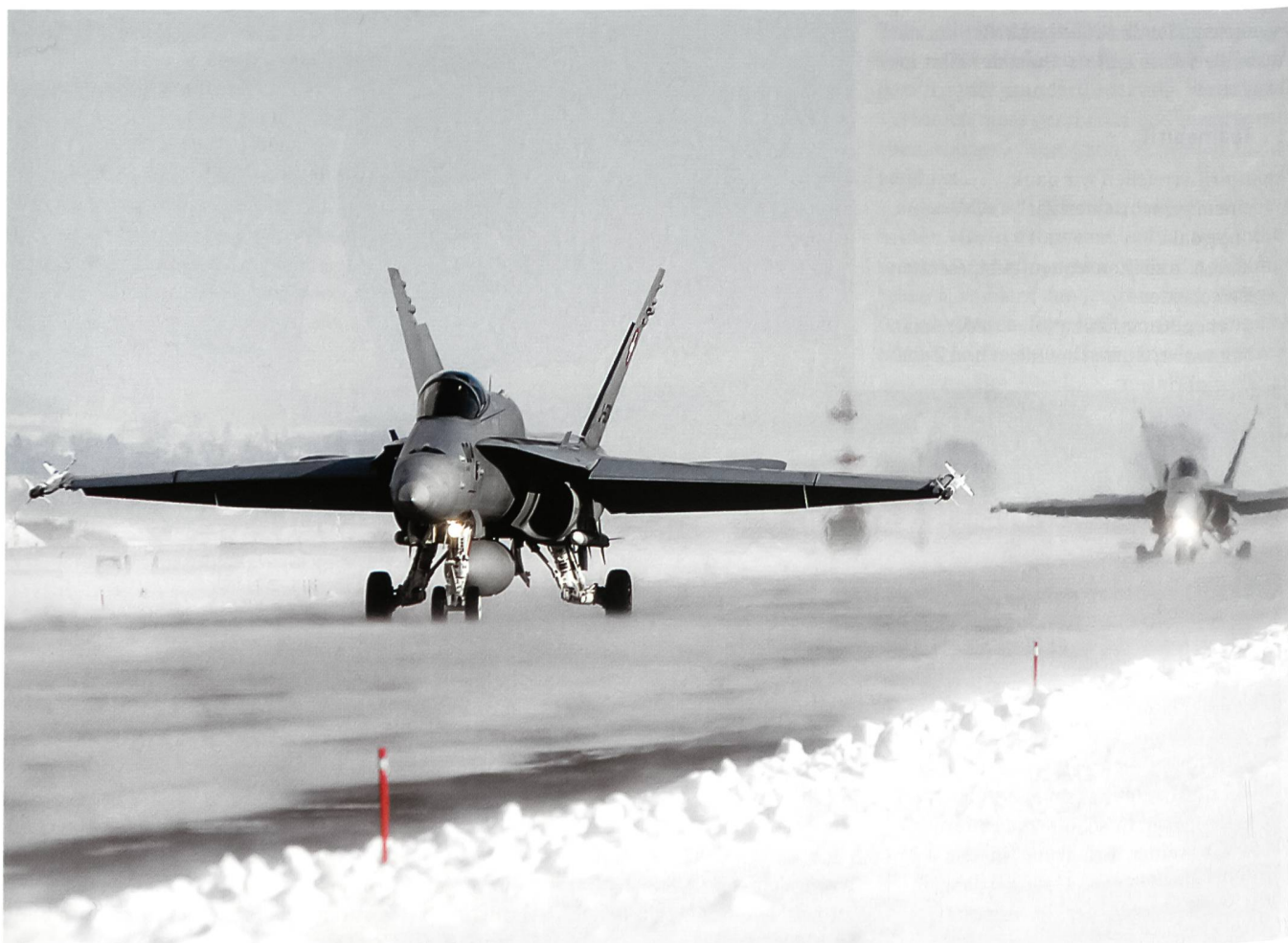
F/A-18 im WEF-Einsatz.

Zugegeben, die Arbeit als Referent Verteidigung beim Chef VBS hat nicht immer einen so direkten Bezug zu meinem Ursprungsmetier Luftverteidigung. Aber faszinierend und den Horizont erweiternd ist sie trotzdem in vielerlei Hinsicht.