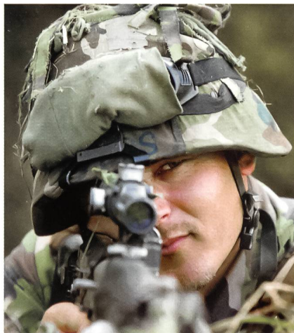
Verantwortung der Vorgesetzten für den Kämpfer an der Front.

Es gilt daher einfach einmal die Prämisse, dass diese moralische Anforderung an die Generalität – ohne Wenn und Aber – zu stellen ist. Die Generäle haben sich als Sicherheitsexperten den grundsätzlichen Fragen der Kriegsführung ihres Staates zu stellen und sich somit auch mit dessen Politik und dem damit verbundenen – leistungsfähigen oder verantwortungsbewussten – Einsatz der Streitkräfte auseinanderzusetzen.