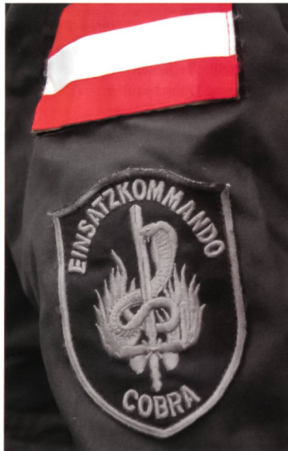
Einsatz- und Nationalitätsabzeichen des Einsatzkommandos (EKO) COBRA. Das EKO zählt zu den polizeilichen Spezialkräften Österreichs.

Das GEK sollte nun für das Bundesministerium für Inneres unmittelbar für besondere und brenzlige Aufgaben im Rah-