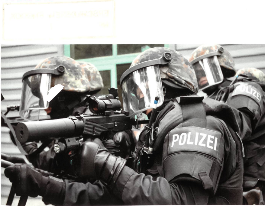
Einsatzformation des EKO COBRA mit der zu Versuchszwecken eingeführten Brügger & Thomet MP9 im Kaliber 9 mm x 19 mit Schalldämpfer und Aimpoint-Visier.

beamte aus ganz Österreich konnten sich nun zum Dienst bei COBRA bewerben. Tatsächlich hatte die Transformation von Lokalpolizei und Gendarmerie zu einer einheitlichen Polizeistruktur und zu erheblichen Verbesserungen geführt. Unter anderem soll ab jetzt theoretisch in 70 Minuten jeder Punkt in Österreich mit einem COBRA-Team erreicht werden können.