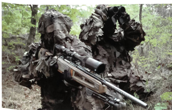
Scharfschütze und Beobachter des EKO COBRA in Stellung. Man beachte den synthetischen Laubtarnanzug und das Steyr-300-CISM-Matchgewehr im Kaliber .308 WinMag.

Dazu kommen eine einheitliche Führungsstruktur, einheitliche Ausrüstungs- und Ausbildungsstandards, internationale Kompatibilität und endlich eine durchgehende Falllösungskompetenz. Dies konnte jedoch nur geschehen, da man die bestehenden MEKs und SEGs aufgelöst und teilweise das Personal, Material und die speziellen Fähigkeiten übernommen hatte. Im Zuge des Projektes «Team04 – die neue Exekutive» wurde dann im Juli 2005 zusätzlich zu den bisherigen Standorten in den Bundesländern der Standort EKO COBRA Wien in der Rossauer Kaserne ausgebaut.