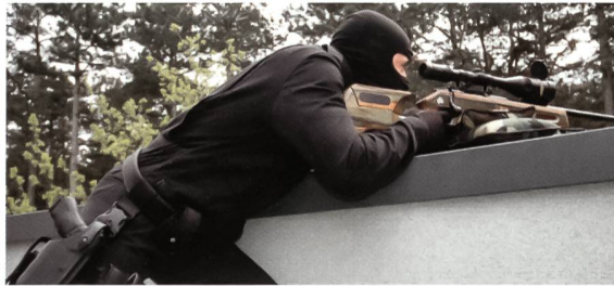
EKO-COBRA-Scharfschütze in Stellung. Das CISM-Gewehr besitzt ein SBS-96-Verschlussystem, einen justierbaren Schichtholzschaft, einen Druckpunktabzug sowie einen gehämmerten Matchlauf. Auf der Waffe sitzt ein Swarovski-Zielfernrohr 6-24x50.

gesamt zirka 75 Beamte ihren Dienst, 25 davon in einer Aussenstelle. In Innsbruck sind es zirka 64 Polizisten. 14 von ihnen versehen ihren anspruchsvollen Dienst jedoch in der Aussenstelle. Die Einsatz-einheiten eins bis vier haben je zehn Beamte zugeteilt bekommen und die Einsatz-einheiten fünf und sechs in den Aussenstellen jeweils zwölf Profis. Beim Einsatzkommando Ost in der Wiener Neustadt sind es sogar 122 Beamte.