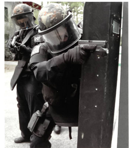
Das EKO COBRA übernimmt auch Antiterroraufgaben. Hier mit ballistischem Einsatzschild. Dahinter sichert ein Beamter mit einer Repetierschrotflinte.

Zu neuen Aufgaben zählt nun auch die Unterstützung der kriminalpolizeilichen Organisationseinheiten bei der Verhaftung gefährlicher Täter oder bei Zugriffen im Bereich der organisierten Kriminalität. Zwar konnte man dies auch schon vorher durchführen, aber nun wurde es zum alltäglichen Geschäft für die Profis von COBRA. Des Weiteren brachte die im Jahr 2002 durchgeführte Reform der Staatspolizei für COBRA weitere Aufgaben mit sich. Ihr wurden so zum Beispiel alle Personenschutzdienste in ganz Österreich übertragen. Zu den traditionellen Aufgaben gehören aber nach wie vor der Einsatz bei Geisel- und Amoklagen, die Erstürmung von Luftfahrzeugen, die