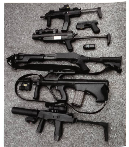
Mögliche Bewaffnung eines EKO-COBRA-Einsatzteams: HK MP7, Glock 17, MZP1 alias HK 69, Remington 870 Steyr AUG A2 und B&T MP9.