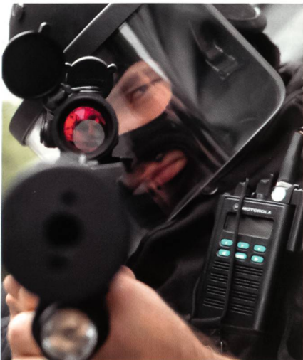
Blick ins gefährliche Ende einer MP9 mit Aimpoint-Military-Visier und Insight-Technology-Laser-Licht-Modul M6X.

Anders schon die Aufteilung bei den Einsatzkommandos Mitte, Süd und West. In Graz und Linz versehen dazu ins-