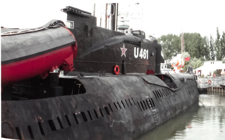
In unmittelbarer Nähe des Museums von Peenemünde kann auch dieses ehemalige sowjetische konventionelle Uboot der Juliett-Klasse besichtigt werden. Seine Hauptbewaffnung waren vier SS-N-3 Shaddock-Marschflugkörper, die zum Einsatz gegen alliierte Überwasser-Kampfschiffe geplant waren.