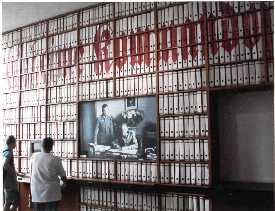
Im Kraftwerkbau des Museums ist auch diese Dokumentationsstelle des für die Entwicklung der V2 verantwortlichen militärischen Chefs, General Walter Dornberger, zu besichtigen. Der Schriftzug «Geheime Kommandosache» ist über der riesigen Front der Ordner zu lesen.

Eine umfassende Begehung ausserhalb des Museumsgeländes mit Besichtigung von Überresten der Abschussanlagen kann in diesem Nordteil Usedom nur mittels spezieller Führungen gemacht werden.