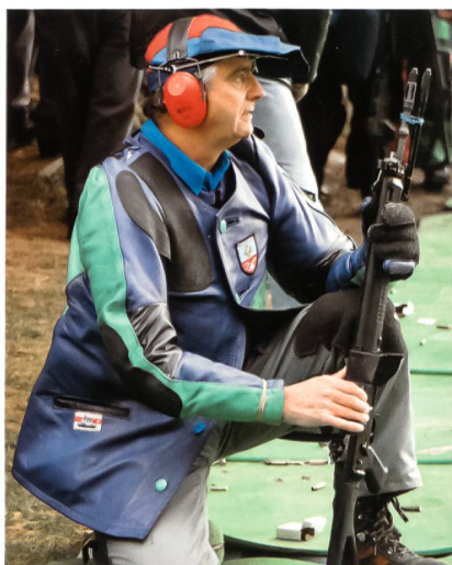
Die Waffe gehört zum Schweizer.

Am 27. September 2007 hiess der Nationalrat mit 100 zu 72 Stimmen eine Motion der ständerätlichen Sicherheitskommission gut, die verlangt, dass die Taschenmunition künftig im Zeughaus gelagert wird.