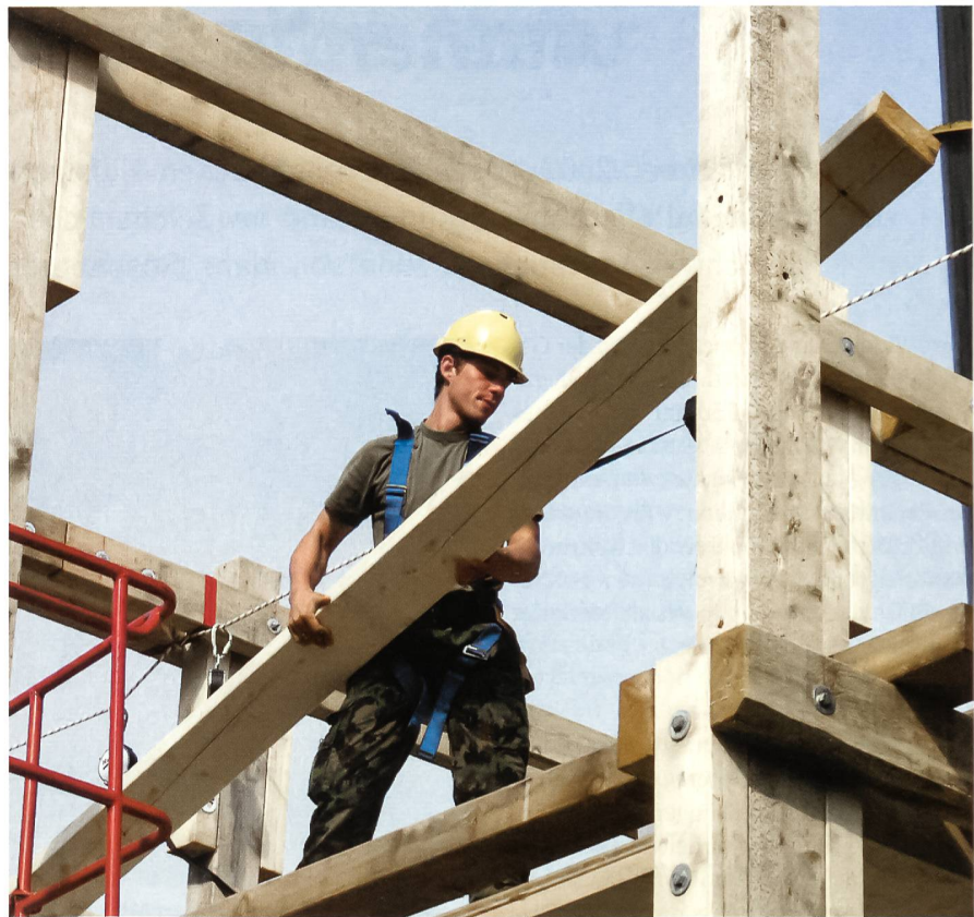
Gut gesichert, in luftiger Höhe werden Querträger versetzt.

vieren hier sozusagen ihr Praktikum, meinte er weiter.