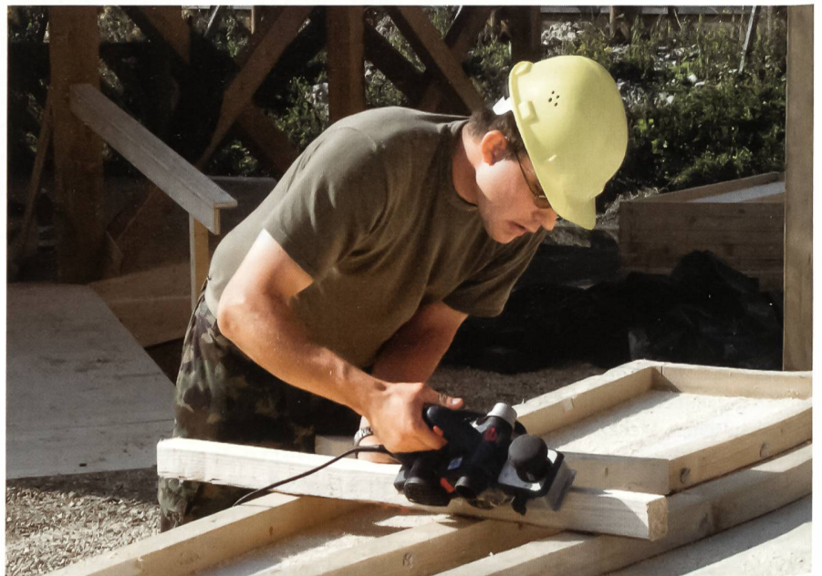
Mit ruhiger Hand werden Holzteile genau zugeschnitten.

Der Kranwagen hievt die vorbetonierten Sockel auf die Strassenmitte und setzt sie präzise am vorgesehenen Ort ab. Danach wird der Mittelträger eingebaut und genau eingemessen. Es wird millimetergenau gearbeitet. Jetzt nähert sich ein Steyr-Langmaterialtransport, die orangen Drehlichter blinken durch die Nacht. Der Motorfahrer fährt 21 Meter lange Stahlträger heran, welche kurz darauf über der Fahrbahn montiert werden. Auch er ist mit seinem überlangen Gefährt konzentriert bei