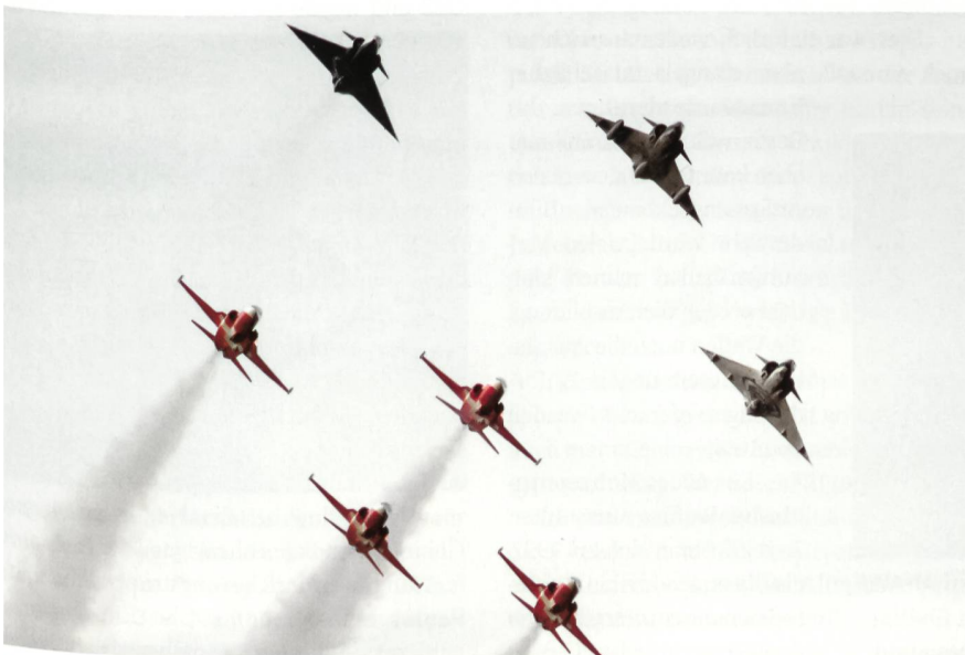
Die letzten Mirage am Himmel über Dübendorf begleitet von 4 PS-Tiger.