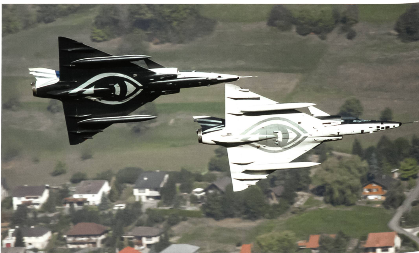
Das letzte Mirage-Jahr mit den zwei Flugzeugen in Spezialbemalung «Black&White».

Im Jahr 2002 nahmen wir dann erstmals an einer grossen COMAO (Combined Air Operation) der NATO im Rahmen PfP (Partnership for Peace) teil. Wir flogen als Aufklärungselement an der Übung ELITE (Electronic Warfare Life Training Exercise) durch echte Flab-Szenarien in Süddeutschland. Wir lernten, uns in grosse Verbände