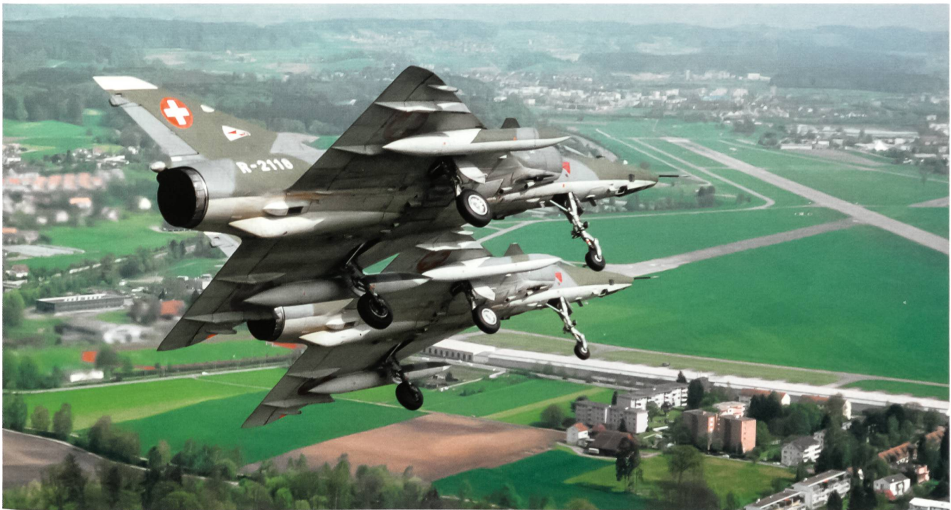
Patrouille Mirage IIIRS im Landeanflug auf die Home Base Dübendorf.

einzuordnen, und waren gezwungen, die englische Voice zu beherrschen.