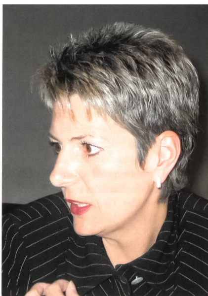
Regierungsrätin Karin Keller-Sutter.

Gestützt auf die Bundesverfassung ist die innere Sicherheit primär eine Angelegenheit der zivilen Behörden, also der Polizei. Das Primat der zivilen Kräfte ist hochzuhalten. Die Bundesverfassung weist in Artikel 58 der Armee Unterstützungsaufga-