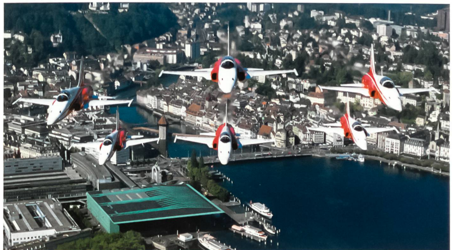
Die Patrouille Suisse im «Doppelpfeil» über dem Luzerner Seebecken.

Der vorliegende Text von Daniel Stämpfli stammt aus dem neuen Buch: Das Überwachungsgeschwader 1992 bis 2005. Die letzten 14 Jahre der traditionellen Berufsformation der Luftwaffe. Herausgegeben von Hanspeter Ruckli, Adrian Urscheler, Matthias Kalt. Das Werk vereinigt spannende Texte und grandiose Bilder. Es kann bezogen werden im Baden-Verlag, 5405 Baden-Dättwil. www.baden-verlag.ch