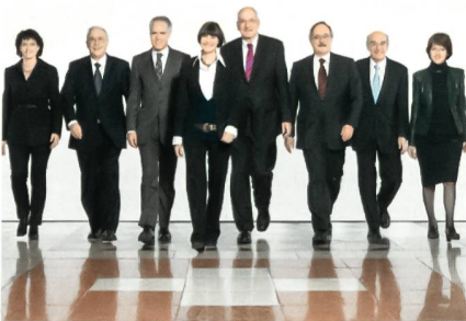
Bundesrat mit Bundeskanzlerin.

Der SiA besteht aus dem Chef des VBS, der Chefin des EDA und dem Vorsteher des EJPD. Der Ausschuss koordiniert departe-