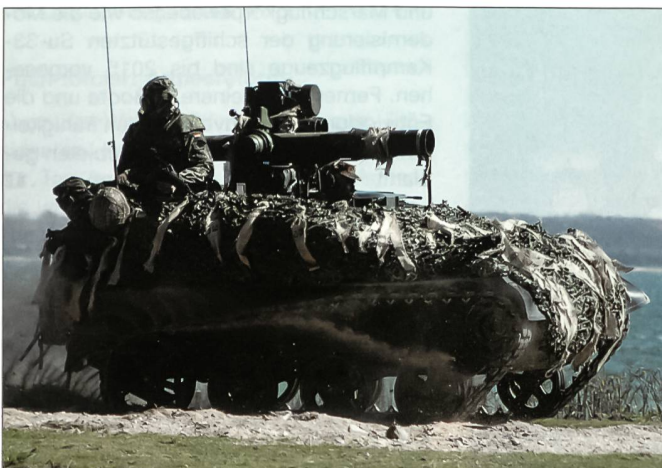
Der Waffenträger Wiesel ist ein kleiner und flinker Luftlandepanzer, der mit einer 20-mm-MK oder mit dem Panzerabwehrsystem TOW bestückt werden kann.

Dazu besteht die Division aus fast 70 Prozent Zeitsoldaten und ca. 30 Prozent frei-