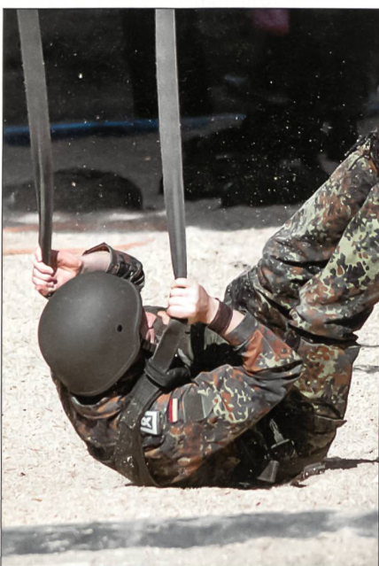
Die Fallschirmsprungausbildung am Sprungturm und an der Pendelanlage ist für die Fallschirmjäger harte Arbeit.

Die Luftlandeaufklärungskompanie 260 ist ebenfalls in der Entstehungsphase. Fallschirmjäger der Brigade haben 1991 an der Operation Kurdenhilfe, 1993 am Ein-