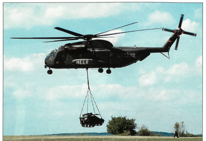
Zwei Wiesel passen in einen mittleren Transporthubschrauber (MTH) CH-53G, und er kann auch als Aussenlast transportiert werden. Die Besatzung besteht aus zwei Soldaten.