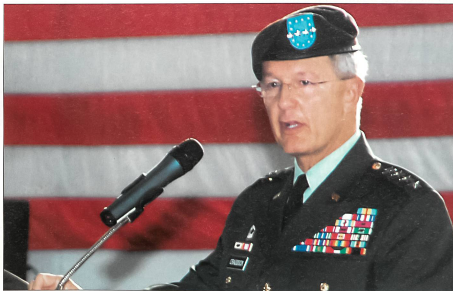
General Bantz J. Craddock anlässlich des Kommandowechsels in Stuttgart.

Sämtliche Operationen der NATO, die früher sowohl vom Allied Command Europe als