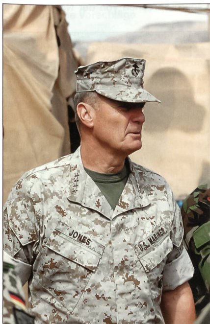
General Jones im Kampfanzug.