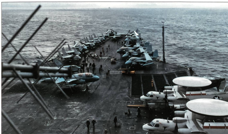
Im November 1987 kreuzte die USS Enterprise anlässlich von grossen Seemanövern der 3. US-Flotte in der Beringsee, unweit der Inselkette der Aleuten. Wechselhaftes kaltes Wetter und teils hoher Seegang stellten höchste Ansprüche an fliegende Besatzungen und die Mannschaft des Trägers. Auf dem Vordeck der Big E sind A-7E-Corsair-II- und A-6E-Intruder-Jagdbomber, EA-6B-Prowler-Elektronik-Flugzeuge und E-2C-Hawkeye-Radarfrühwarnflugzeuge zu erkennen.