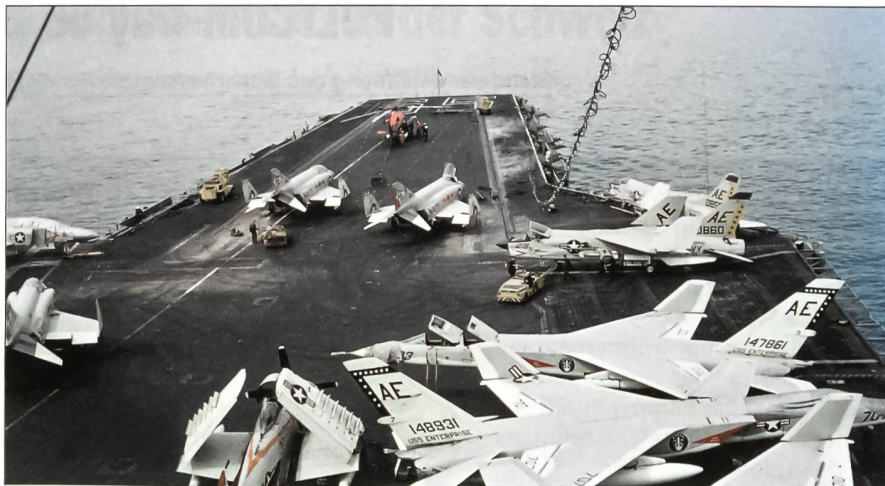
Ende März 1964 besuchte die brandneue USS Enterprise Cannes an der französischen Riviera. Der Autor konnte die Big E dort zum zweiten Mal besuchen. An Bord waren damals gegen 100 Flugzeuge, darunter die Fighter Squadron 102 mit F-4B Phantom II und die Fighter Squadron VF-33 mit F-8E-Crusader-Jagdflugzeugen, die Attack Squadron VA-65 mit A-1H-Skyraider-Propeller-Kampfflugzeugen und die Heavy Attack Squadron VAH-7 mit A-5A-Vigilante-Nuklearbomben. Diese Maschinen sind hier auf dem Vordeck der USS Enterprise erkennbar. Zum Bestand gehörten ferner auch einige Detachements und drei A-4C-Skyhawk-Staffeln. Knapp zwei Jahre später stand die Big E vor Vietnam im Einsatz.

Ihr heutiges Marineflieger-Geschwader 1 zählt drei F/A-18-C/D-Hornet-Staffeln,