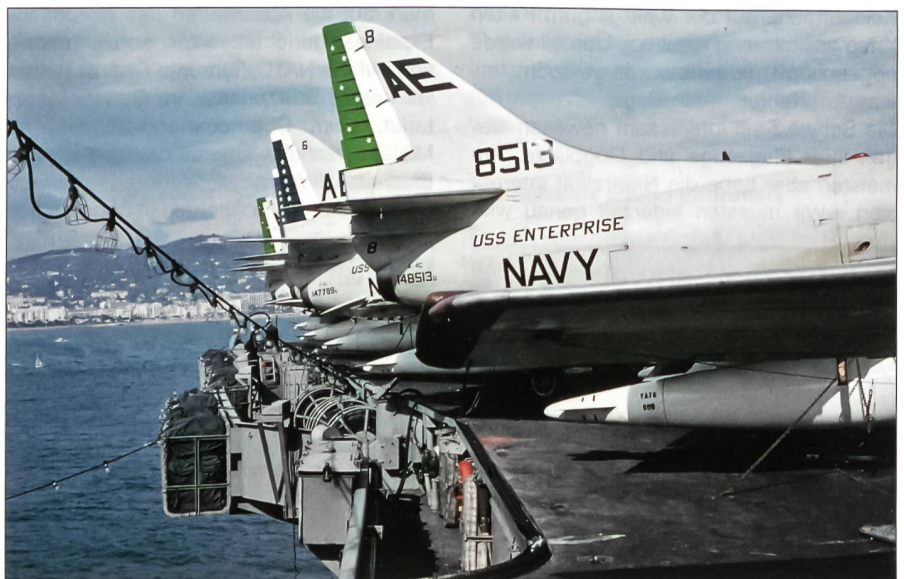
In den 60er-Jahren führte die USS Enterprise drei Staffeln A-4C-Skyhawk-Jagdbomber mit. Hier sind Maschinen von zwei Staffeln (vorne eine A-4C der Attack Squadron VA-76 und hinten solche der Attack Squadron VA-66) auf dem Achterdeck des Trägers parkiert. Im Hintergrund Cannes.

1965 wechselte die USS Enterprise ihren Heimatstützpunkt von Norfolk in den Pazifik. In den Jahren 1965 bis 1972 fuhr sie sechs Mal für jeweils viele Monate in die Gewässer vor Vietnam; erstmals flogen ihre