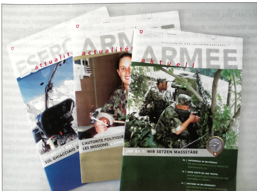
Zweimal im Jahr erscheint «Armee aktuell».