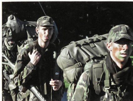
Während der dreiwöchigen Ausbildung sind viele Märsche zu bewältigen.

«Wir prüfen die Leute auch, ob sie zu uns passen, wir suchen keine Rambos und Helden!», stellt der Kurskommandant klar. Im Gegenteil: Die Kursteilnehmer – Soldaten aller Grade – müssen teamfähig sein, über eine gute Kondition und Ausdauer verfügen sowie hohe psychische und physische Belastungen ertragen können. «Denn», so Züger, «uns sind gut funktionierende Teams sehr wichtig, darauf achten wir sehr genau!»