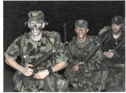
Ankunft der angehenden Commandos nach dem 15-km-Selektionsmarsch.

Nach dem Selektionstag sind die ersten beiden Kurswochen der Eintrittsübung sowie der Grund- und Gefechtsausbildung gewidmet. Sie umfassen Aufklärung, Beobachten, Orientierung im Gelände, In-/Exfiltration, Combatschiessen, Übermittlung,