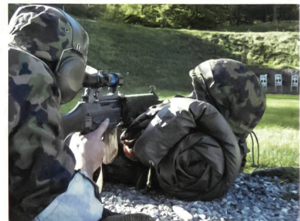
Auch das Schiessen mit dem Zielfernrohr wird trainiert.

Seil- und Übersetztechnik. Die ganze dritte Woche steht im Zeichen der grossen Schlussübung im Tessin.