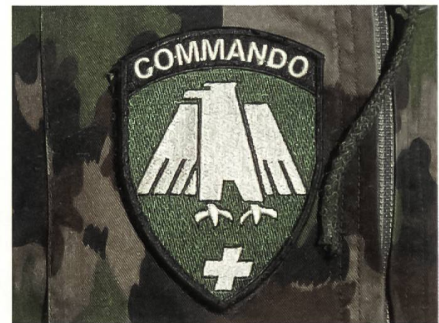
Das begehrte Commando-Abzeichen. Nur die Besten dürfen es tragen.