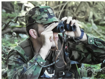
Eine gute Beobachtungsgabe der angehenden Commandos ist wichtig.